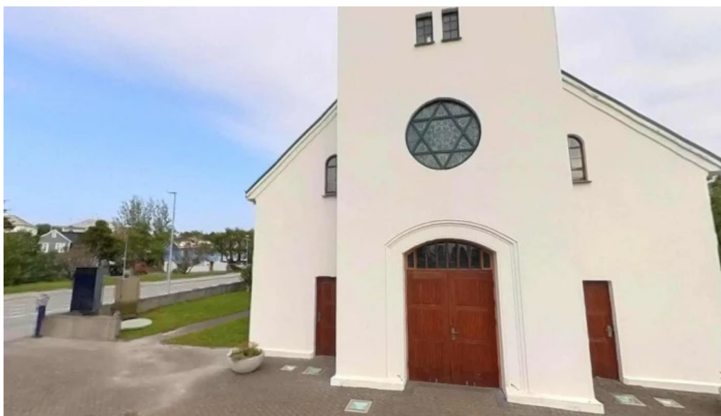
Hafnarfjardarkirkja street view 360