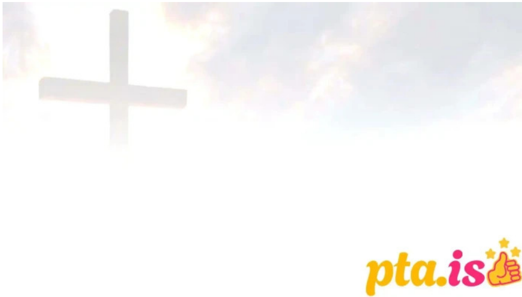
Bodunarkirkjan fra eiganda