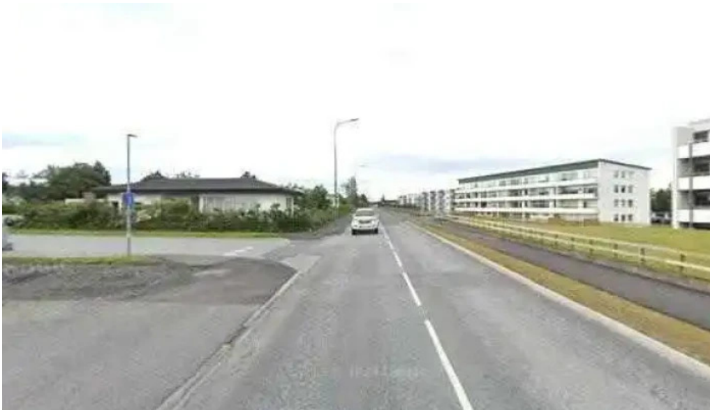
Bodunarkirkjan street view 360deg