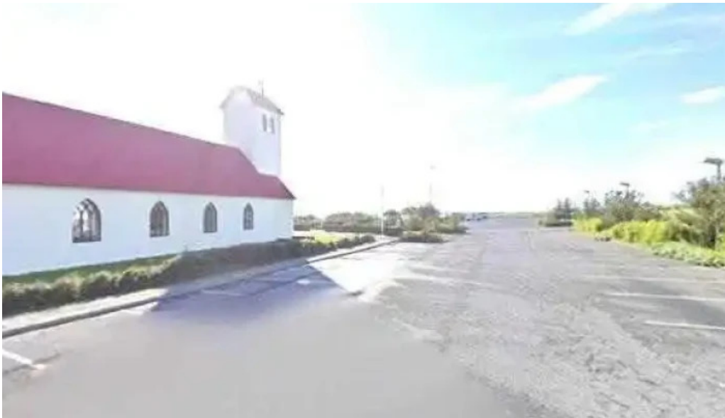
Gardakirkja street view 360deg