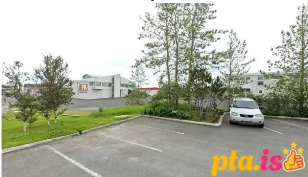
Loftsalurinn aðventkirkjan í hafnarfirði hafnarfjörður