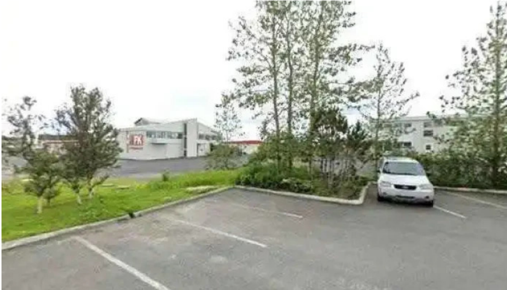
Loftsalurinn adventkirkjan i hafnarfirði kirkja sjounda dags aðventista