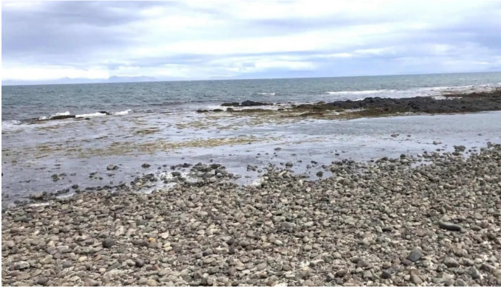
Vitinn i gjogurta opið nuna