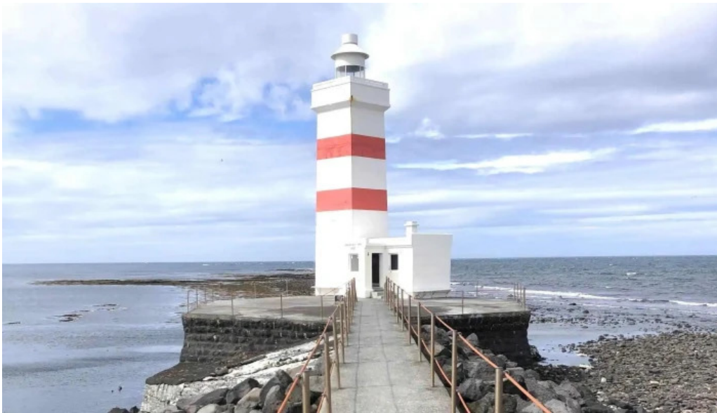
Vitinn i gjogurta kynning