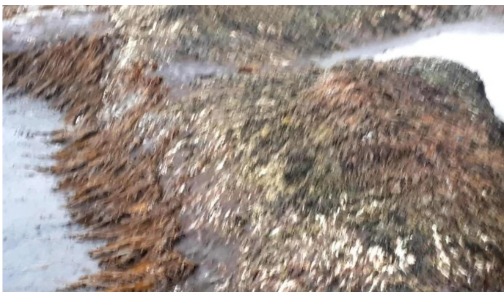
Vitinn i gjogurta svæði