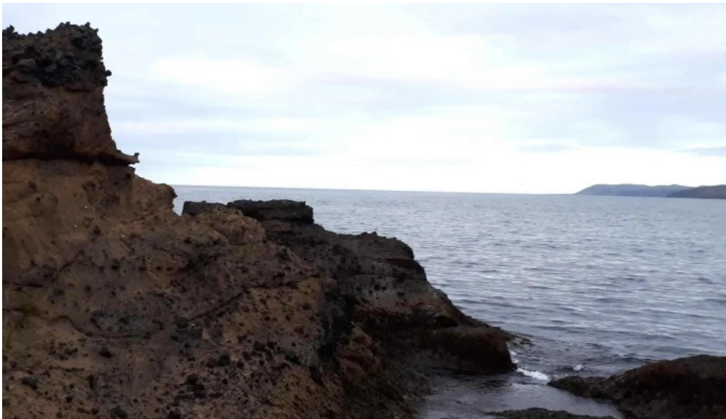
Vitinn i gjogurta simi