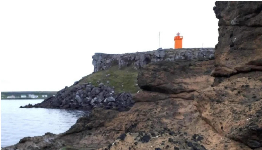
Vitinn i gjogurta garður