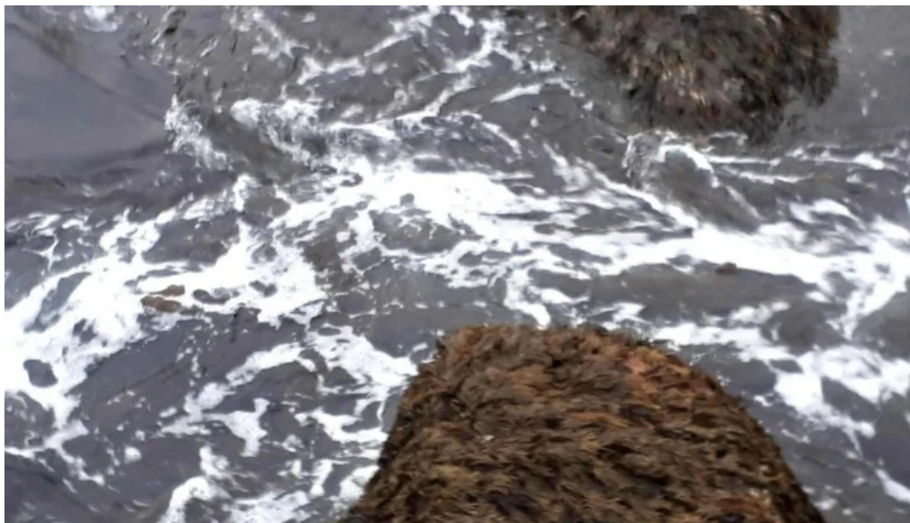
Vitinn i gjogurta mynddir