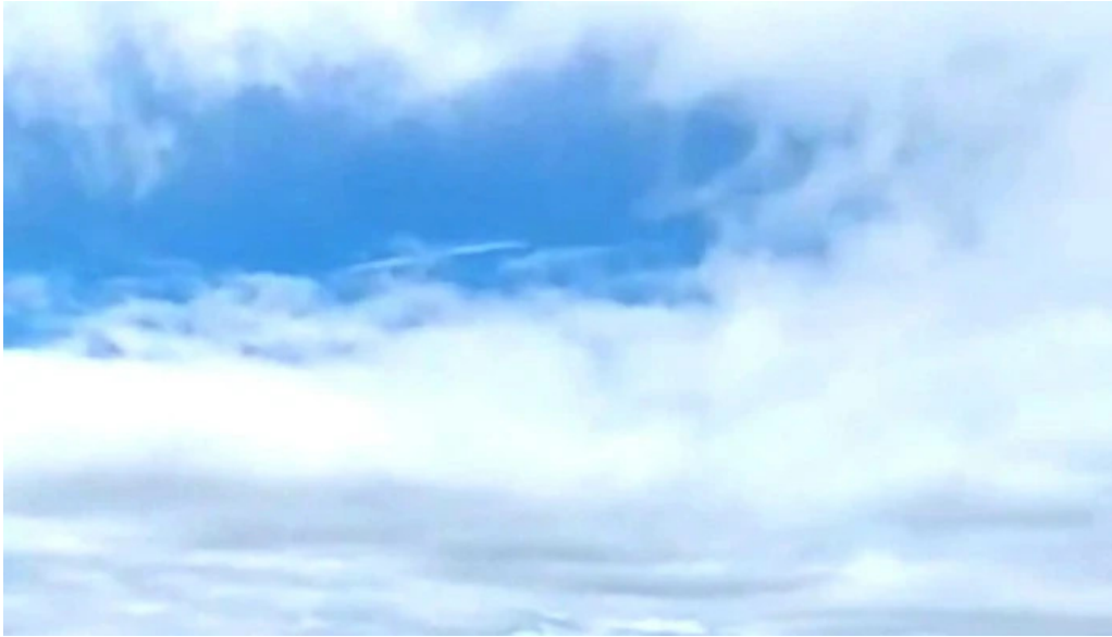
Vitinn i gjogurta myndbond