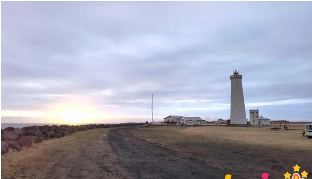
Vitinn i gjogurta nyjast