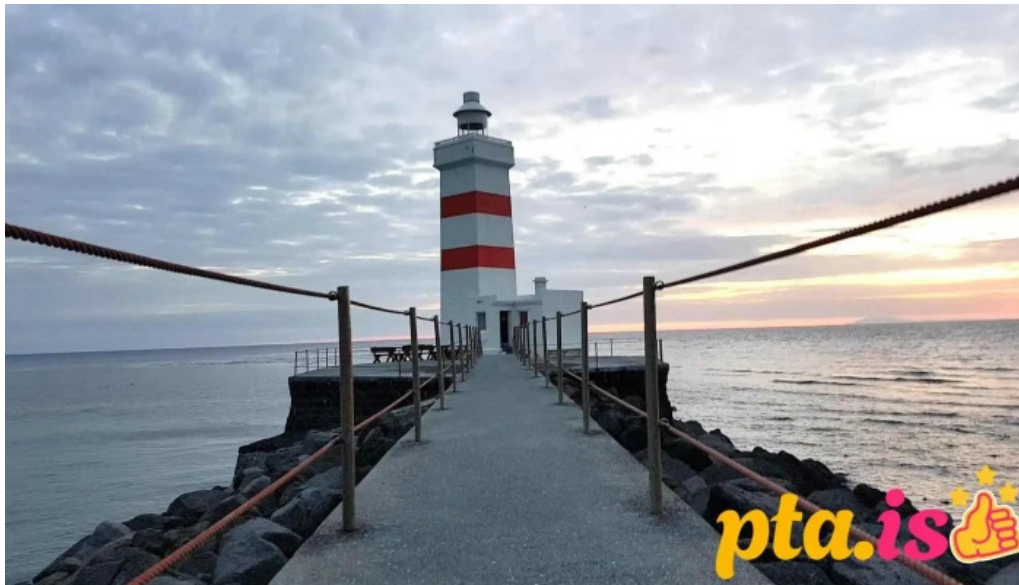
Vitinn i gjogurta myndskeld