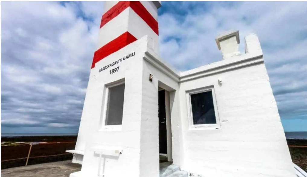
Vitinn i gjogurta street view 360deg