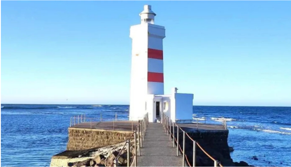
Vitinn i gjogurta kennileiti