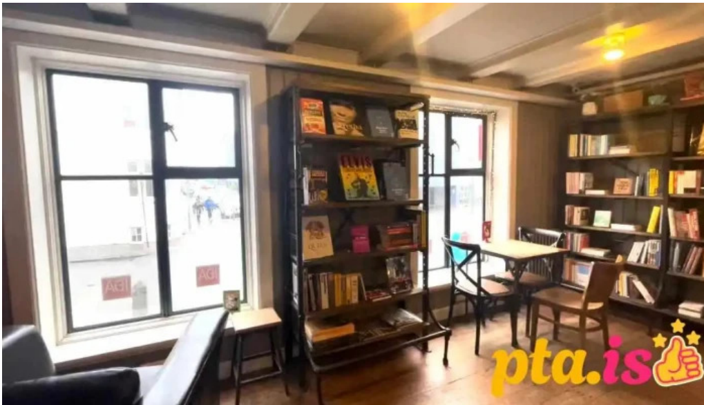
Ida zimsen myndskeld