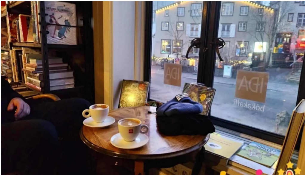
Ida zimsen kaffi