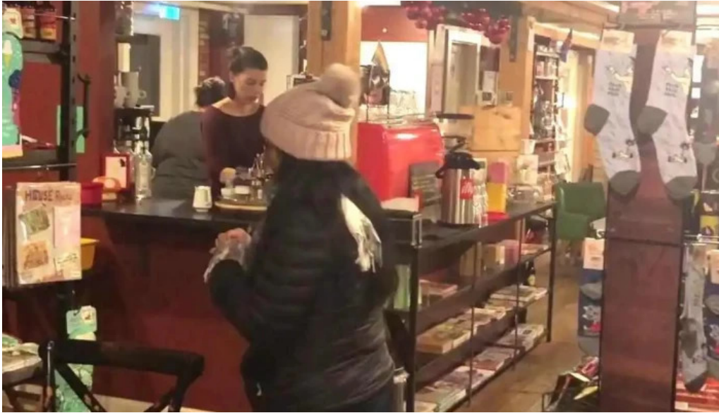
Ida zimsen stemning