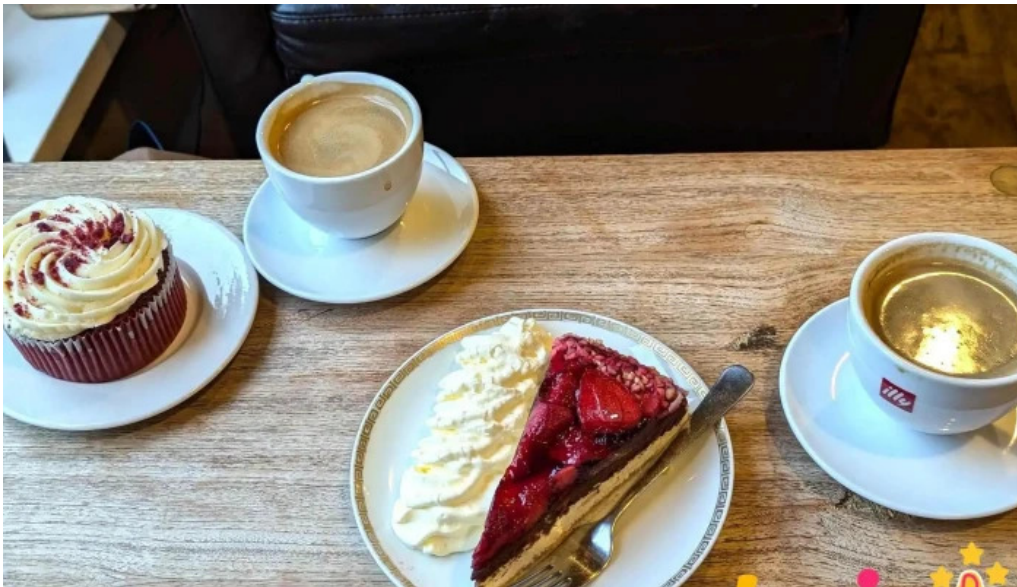
Ida zimsen matur og drykkur