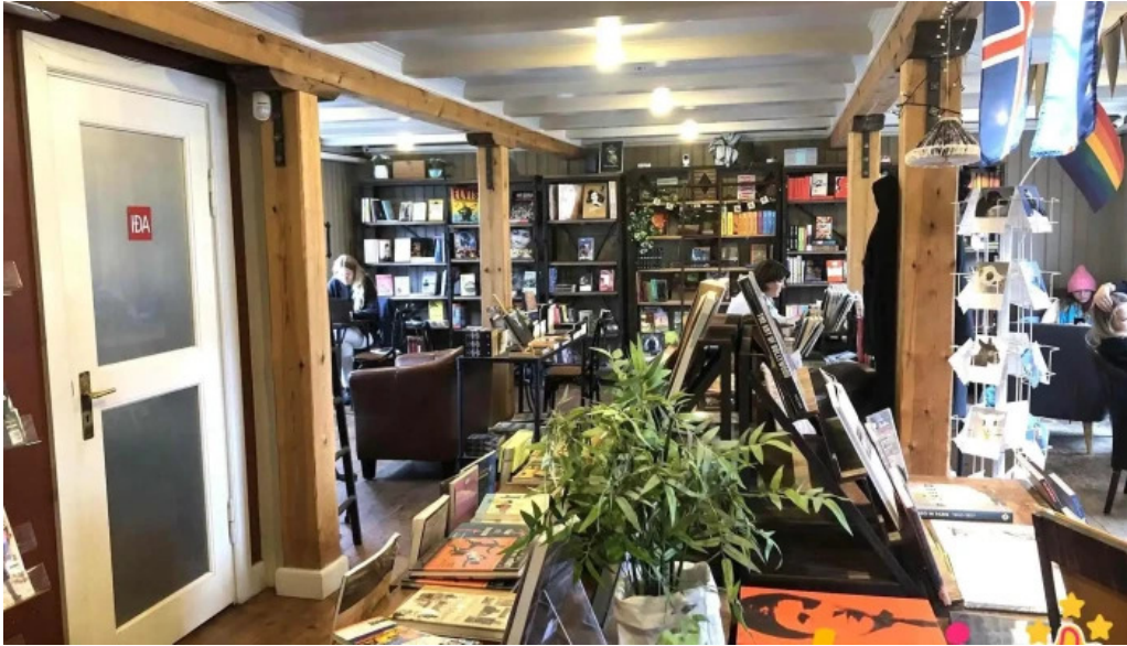
Ida zimsen kaffihus