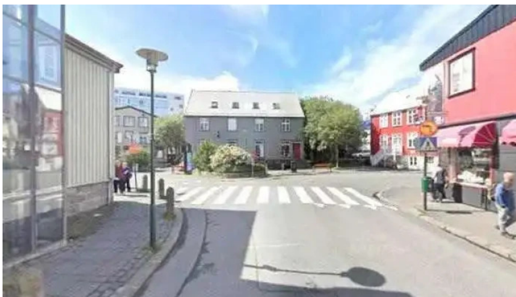
Íða zimsen street view 360