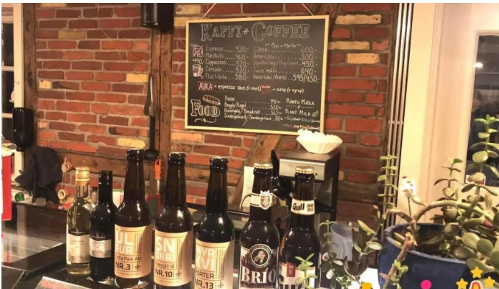
Ida zimsen matsedill