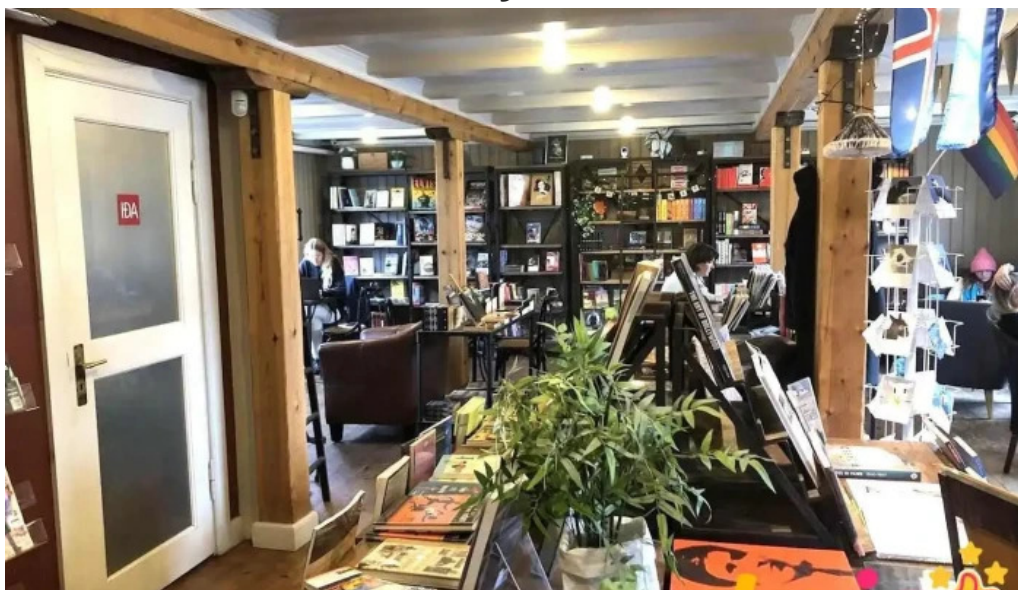
Íða zimsen reykjavik