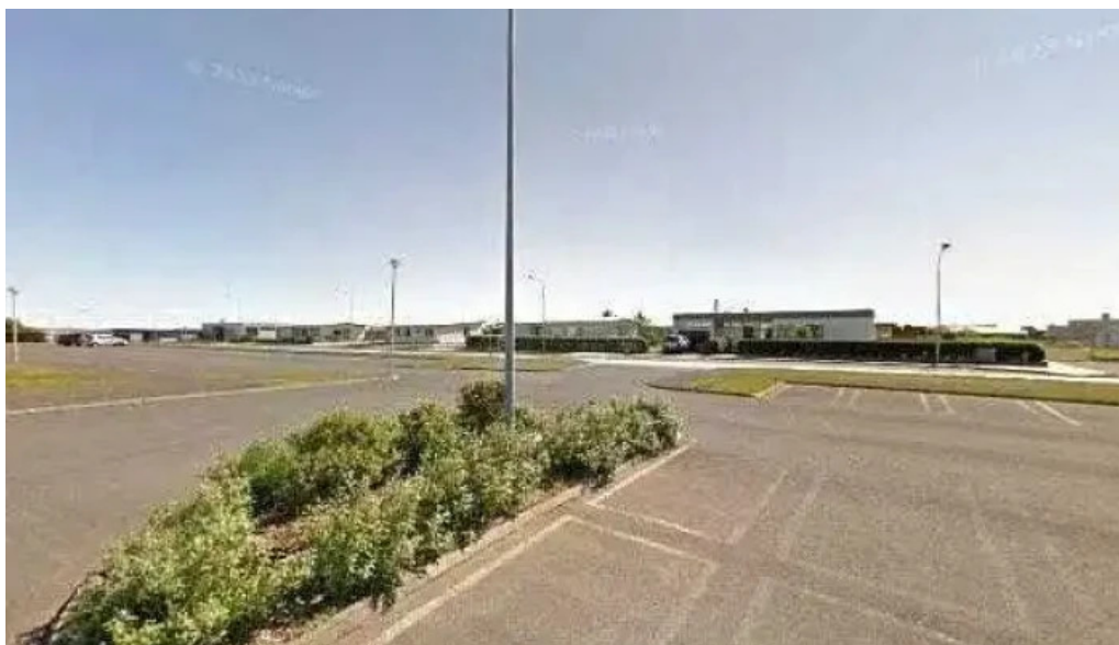
Iþrottahus grindavíkur íþróttavöllur