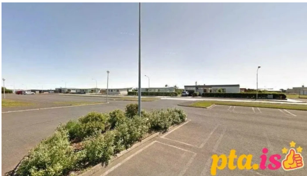
Iþrottahus grindavíkur grindavík