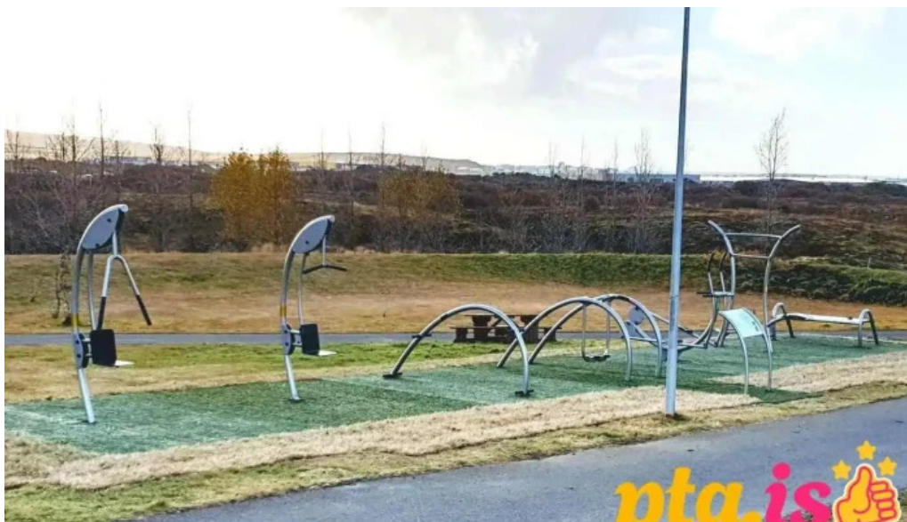
Hreystigardur flatir íþrottavollur