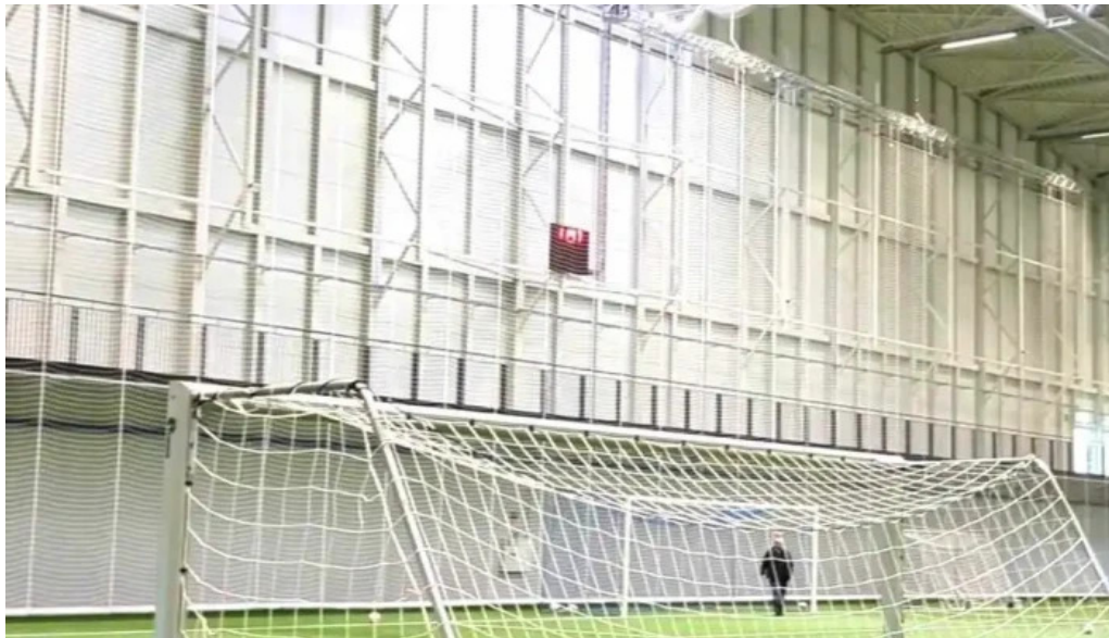
Midgardur fjolnota ithrottahus myndskeld