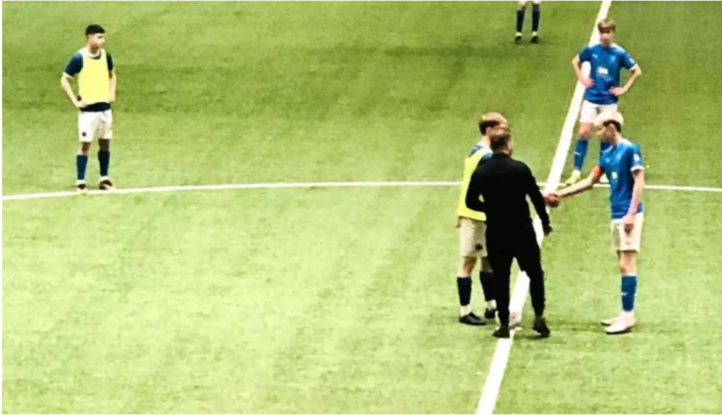
Midgardur fjolnota ithrottahus knattspyrna