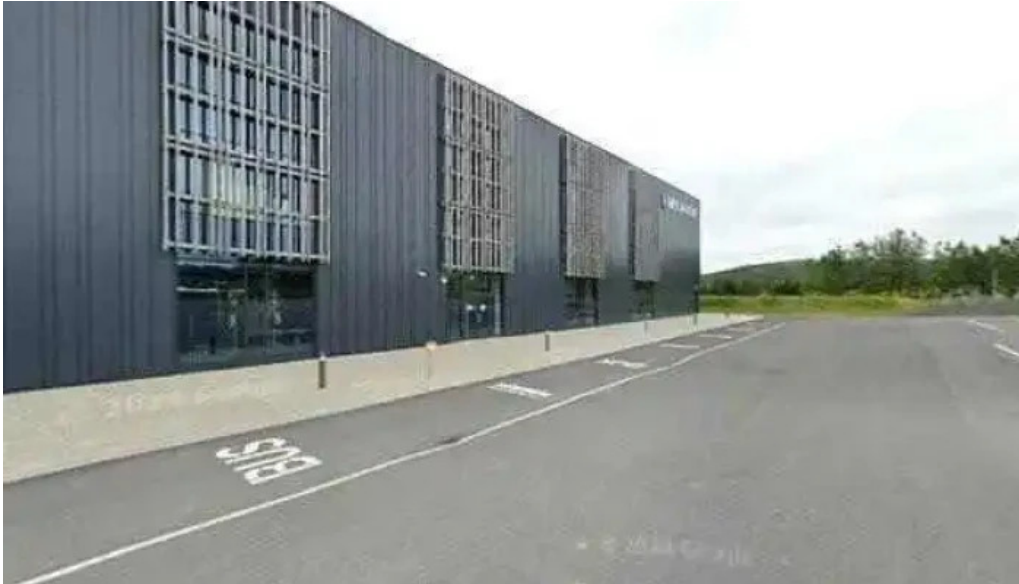
Midgardur fjolnota ithrottahus street view 360deg