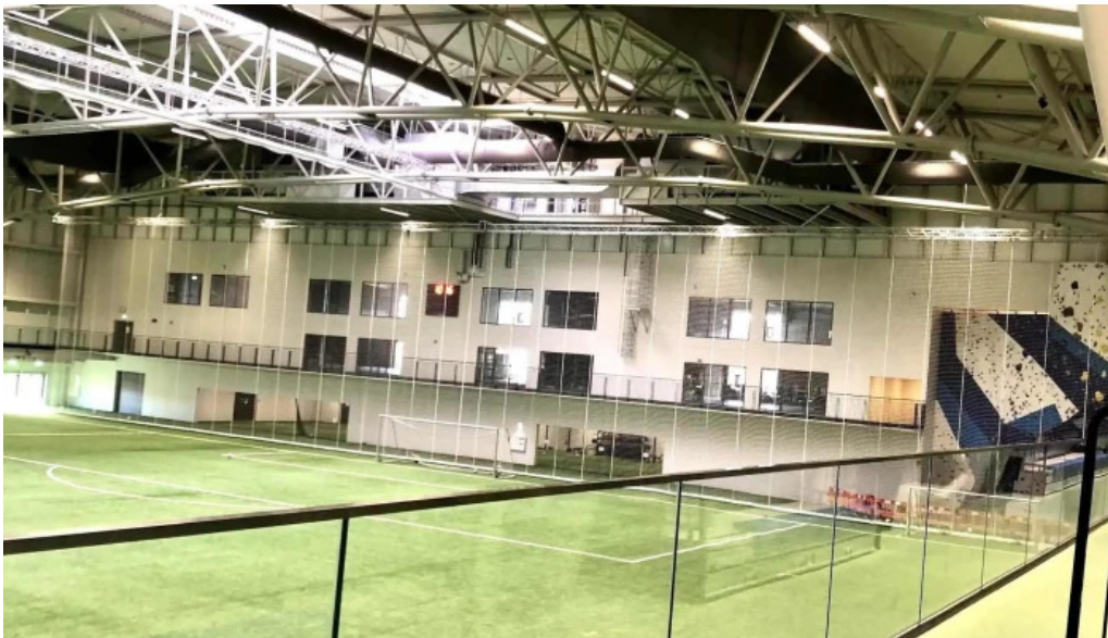
Midgardur fjolnota ithrottahus numer