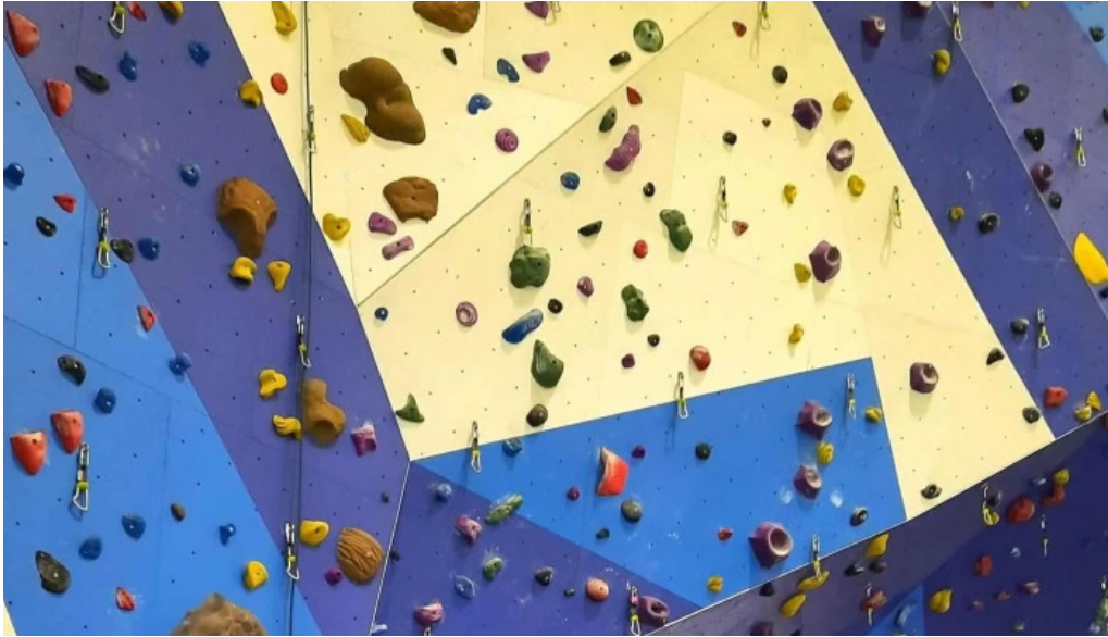
Midgardur fjolnota ithrottahus garðabær