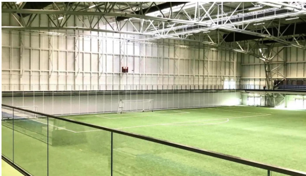
Midgardur fjolnota ithrottahus myndbond