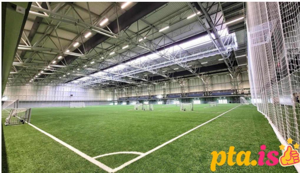
Miðgarður fjölnota íþróttahús garðabær