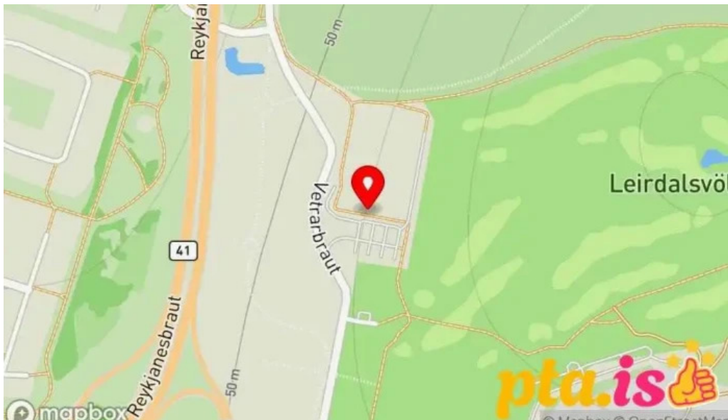
Midgardur fjolnota ithrottahus Kort