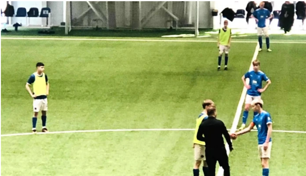
Midgardur fjoInota ithrottahus hvernig a að komast þangað