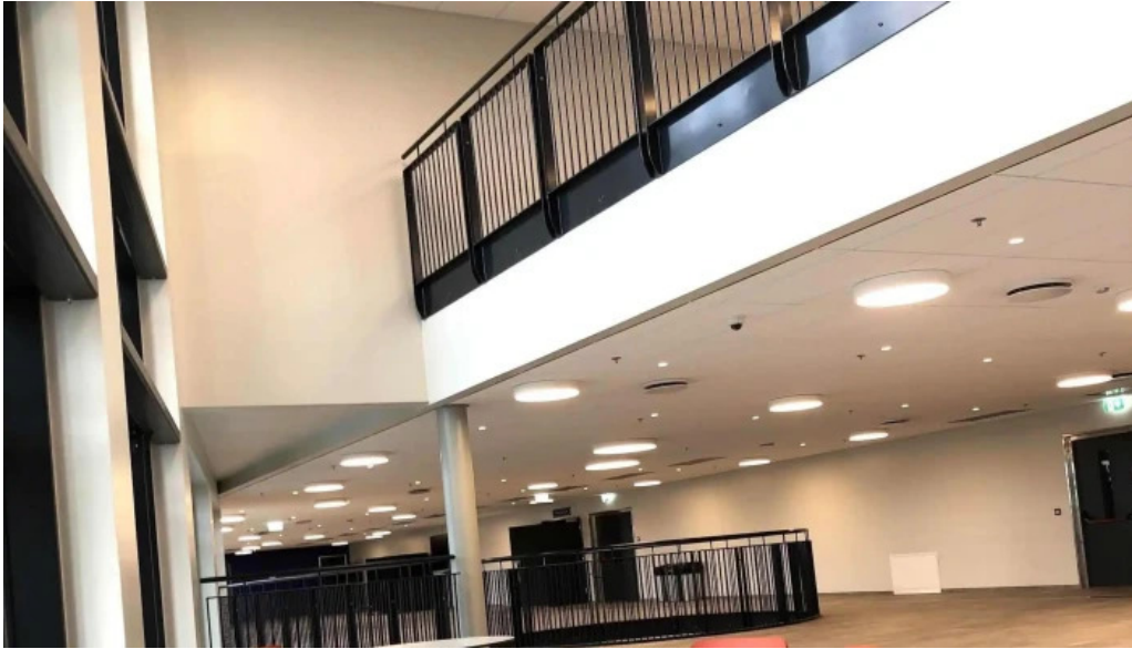
Midgardur fjoInota ithrottahus instagram