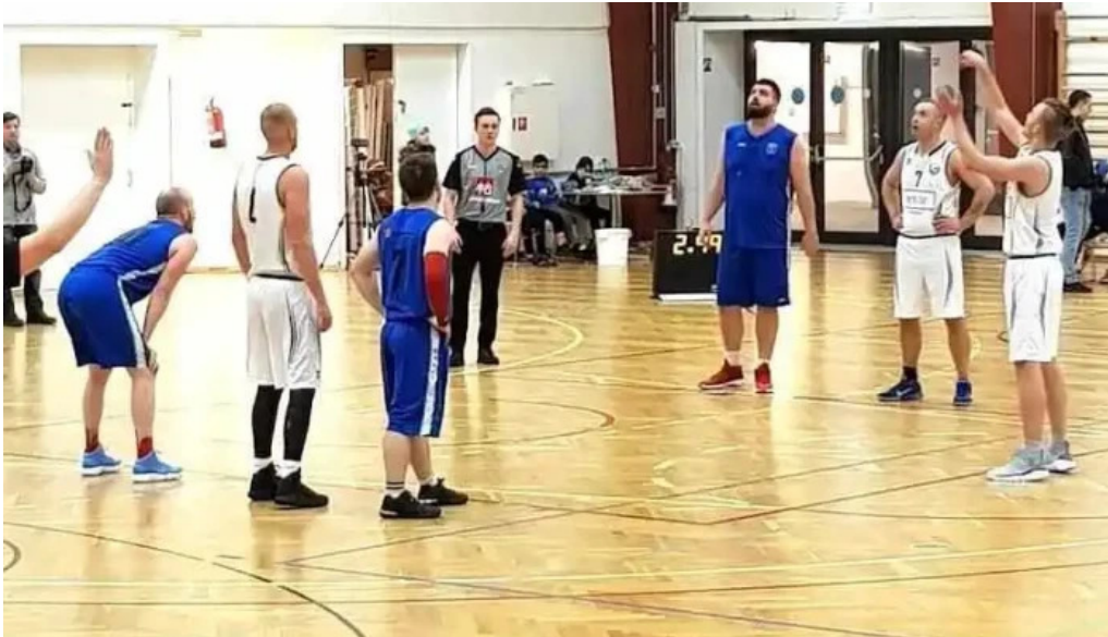
Íþróttamiðstöðin álftanesi kaldalónshöllin álftanes