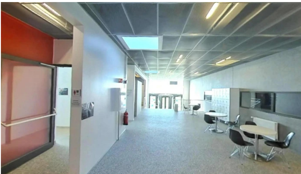
Íþrottamiðstöðin álftanesi kaldalónshöllin street view 360