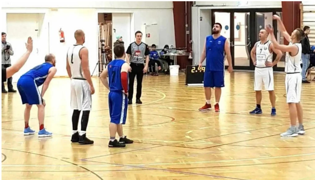
Ithrottamidstodin alftanesi kaldalonshollin íþrottamiðstoð