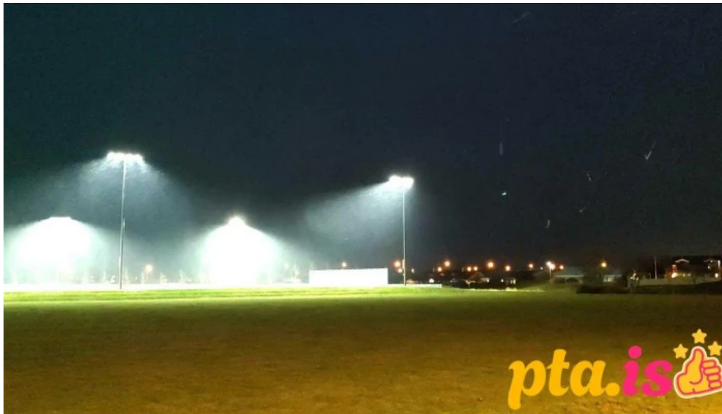
Ithrottamidstodin alftanesi kaldalonshollin myndскеid