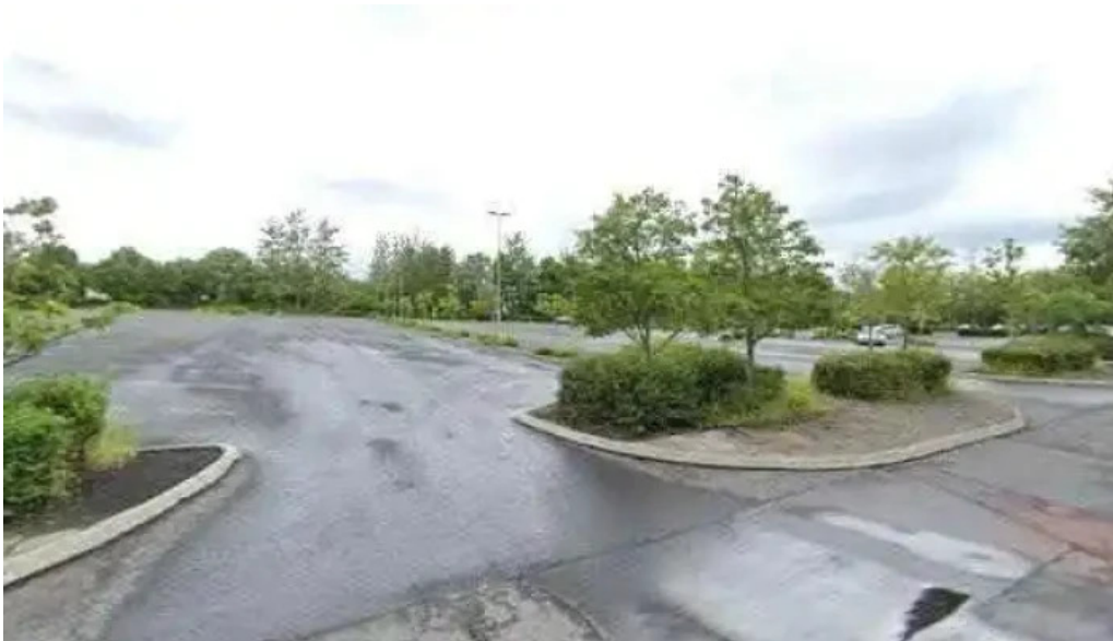
Ksi street view 360deg