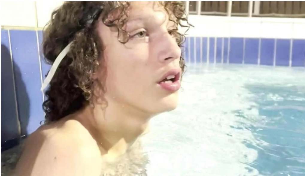
Hestamannafelagid hordur hvar