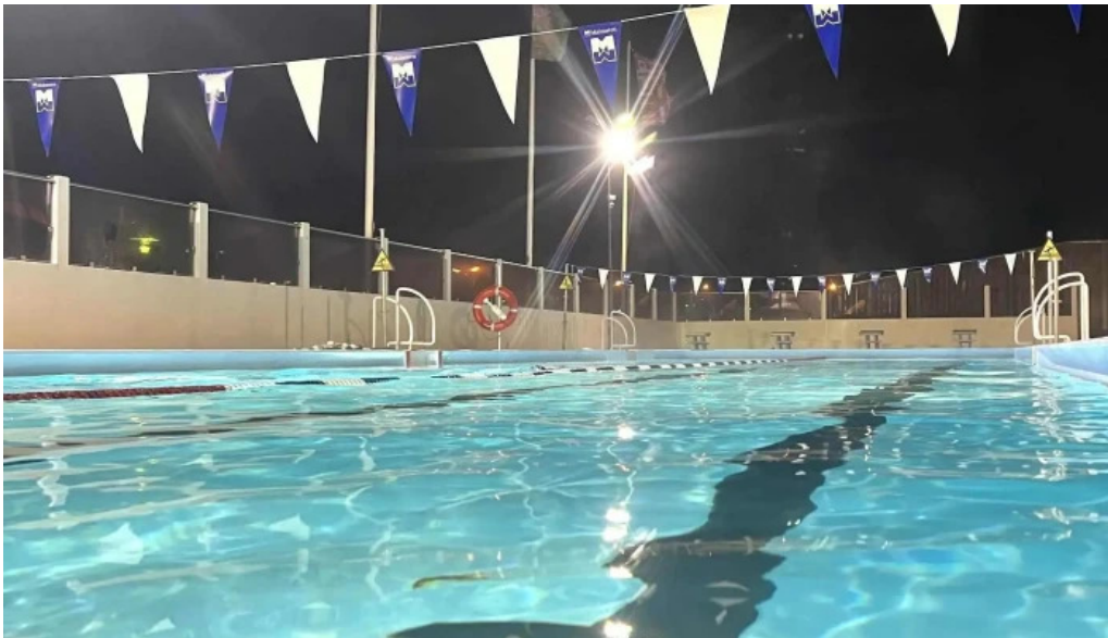
Hestamannafelagid hordur hvernig a að komast þangað