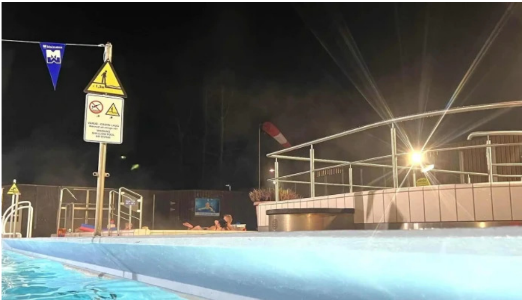
Hestamannafelagid hordur afslættir