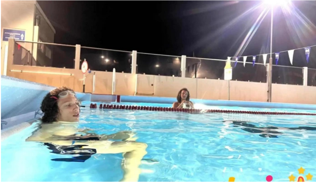
Hestamannafelagid hordur íþrottafelag