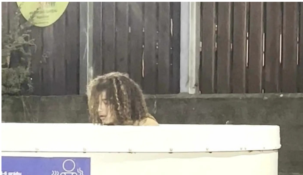
Hestamannafelagid hordur mosfellsbær