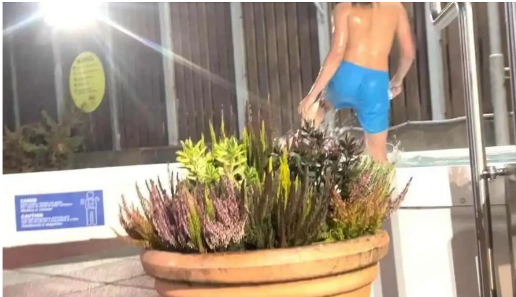
Hestamannafelagid hordur myndskeld