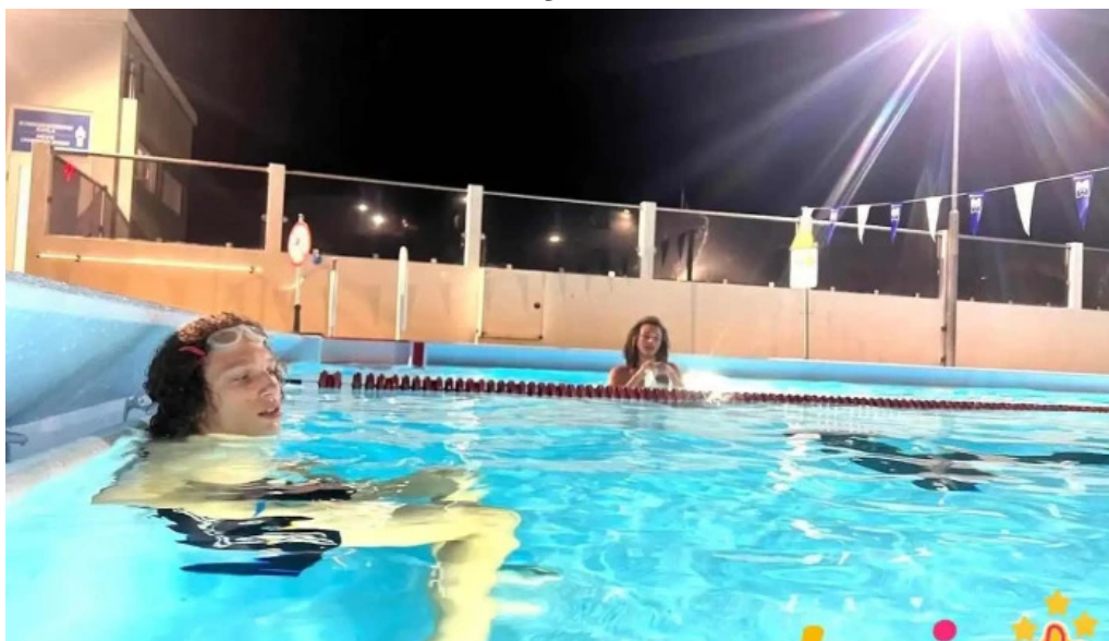
Hestamannafélagið Hörður Mosfellsbær