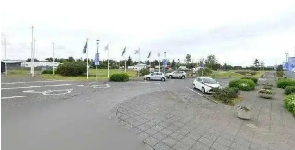
Stjarnan fotbolti íþrottafelag