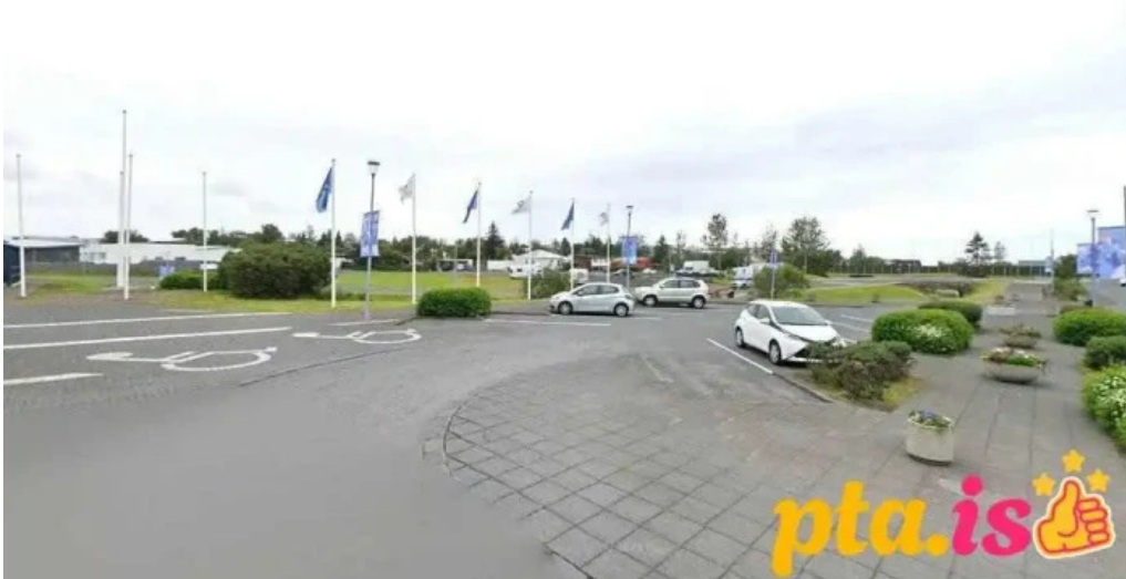
Stjarnan fotbolti garðabær