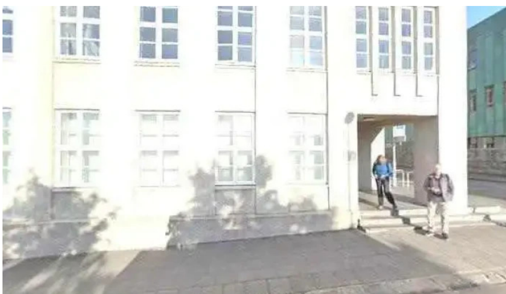
Fjarmala og efnahagsraduneytid street view 360deg