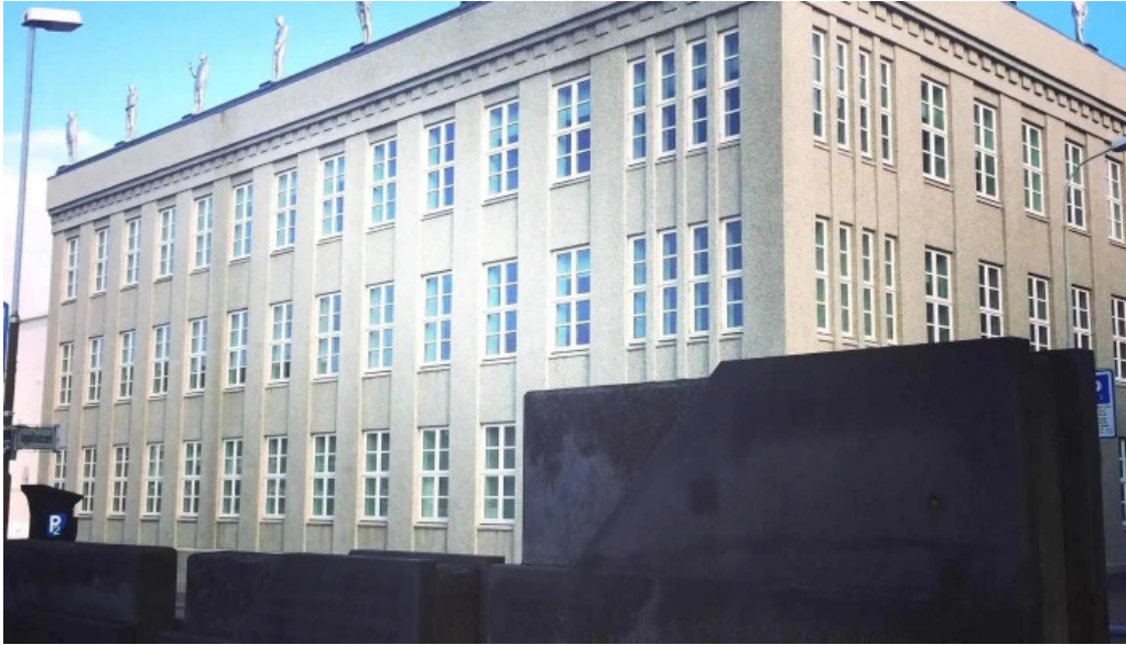
Fjarmala og efnahagsraduneytid reykjavik