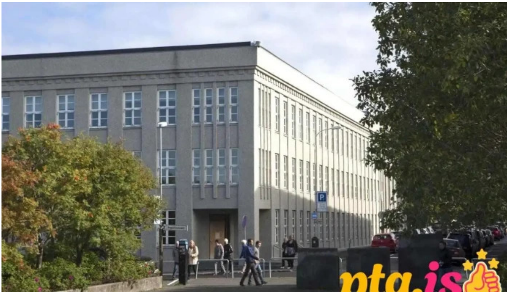
Fjarmala og efnahagsraduneytid islandspostur