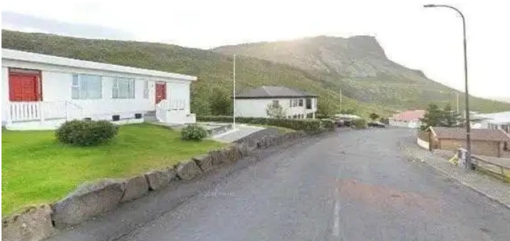
Snæfellsbaer street view 360deg