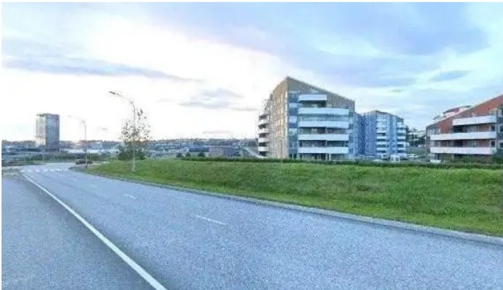
Lindir street view 360deg