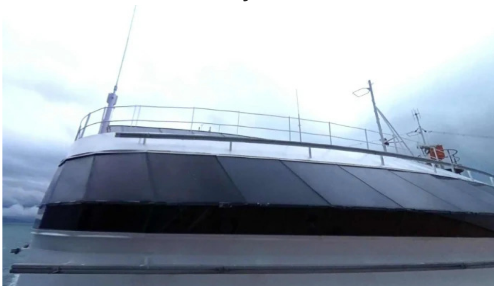
Grenivik street view 360deg