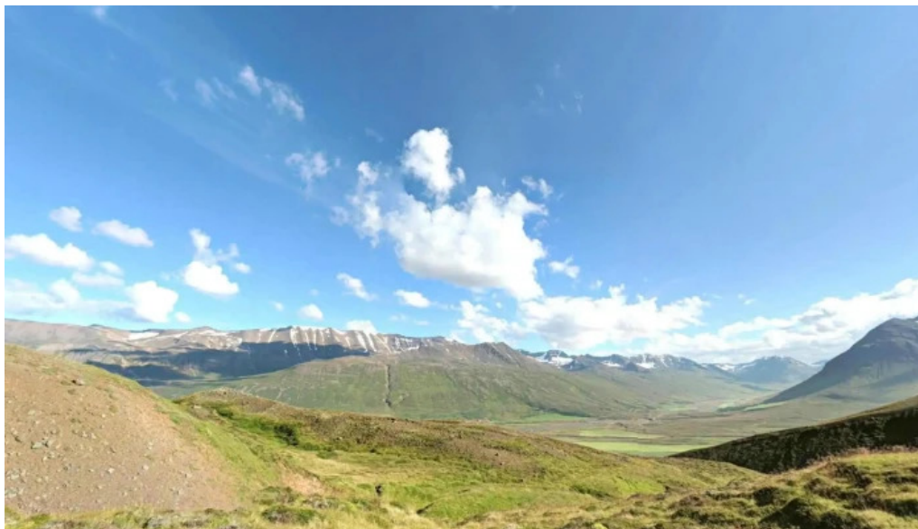
Dalvik street view 360deg