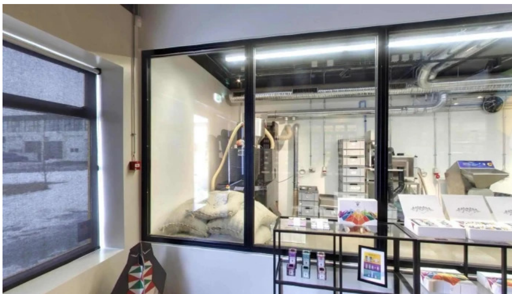
Omnom isbud og súkkuladi verslun street view 360