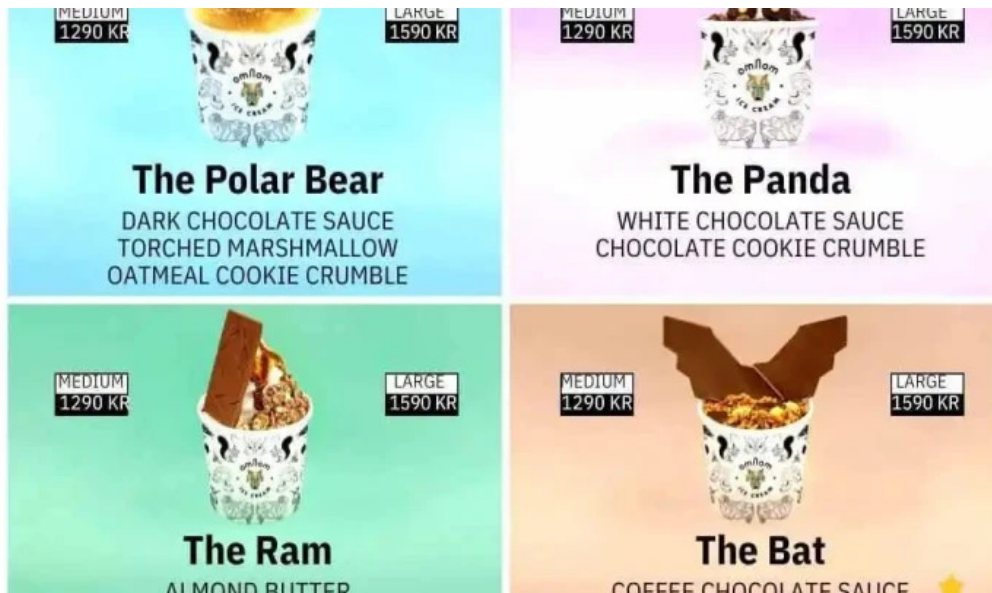
Omnom isbud og sukkuladi verslun matsedill