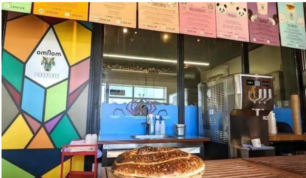
Omnom isbuð og súkkulaði verslun reykjavik