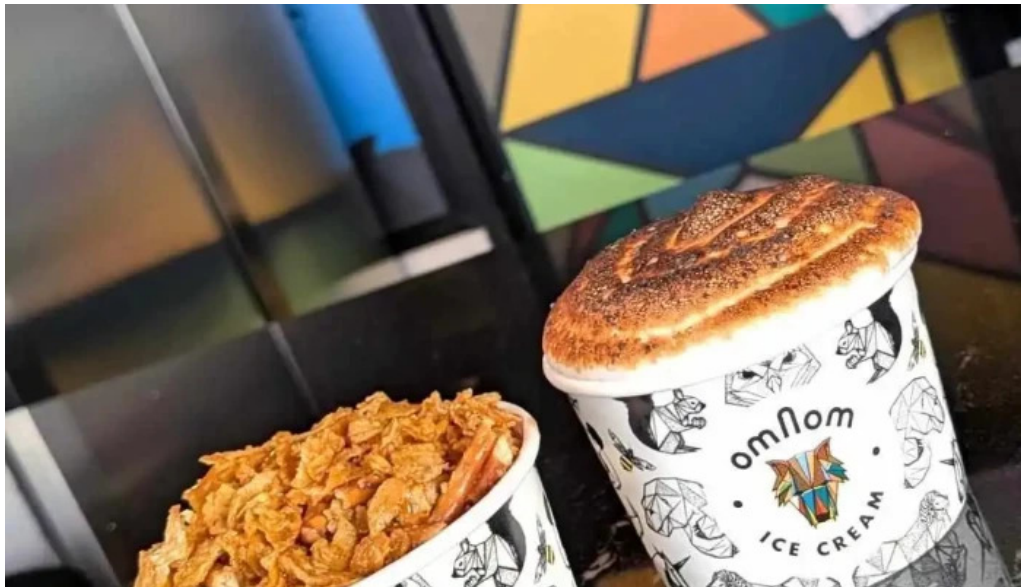
Omnom isbud og sukkuladi verslun nýjast