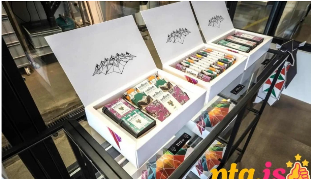
Omnom ísbud og sukkuladi verslun stemning