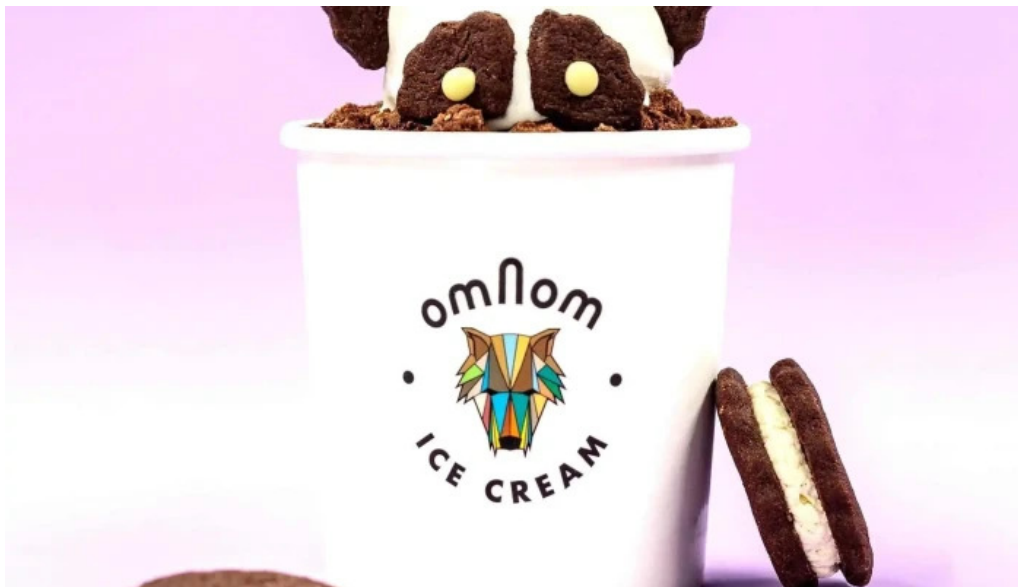
Omnom isbud og sukkuladi verslun matur og drykkur