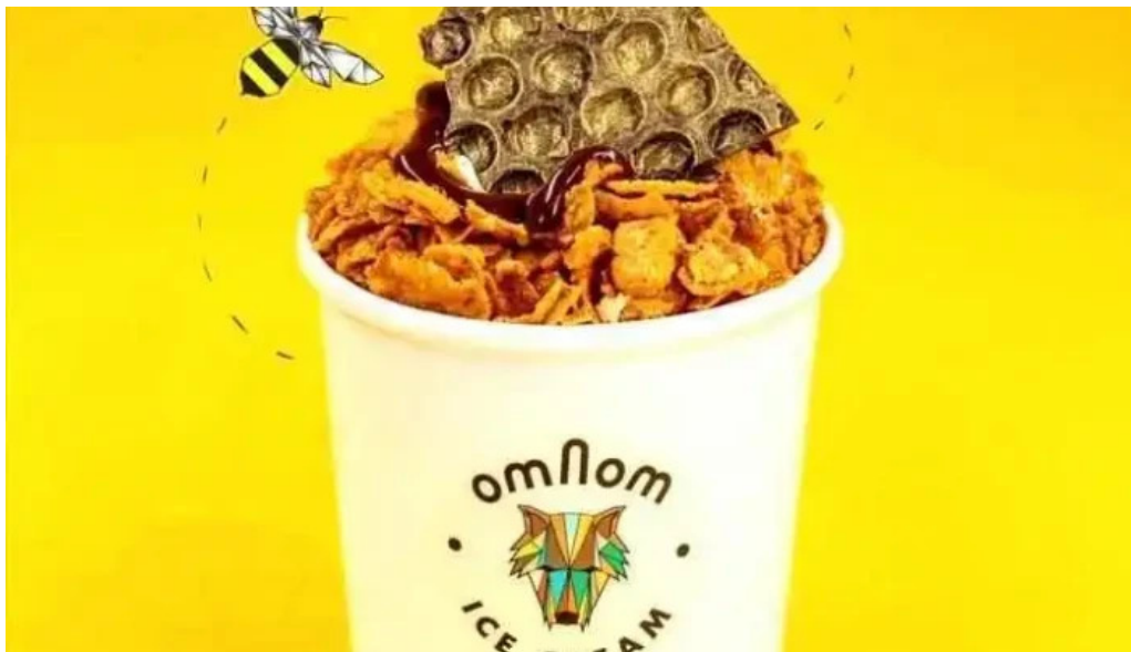
Omnom isbud og sukkuladi verslun myndskeld