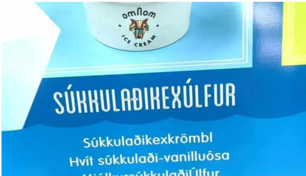
Omnom ísbud og sukkuladi verslun rjomais