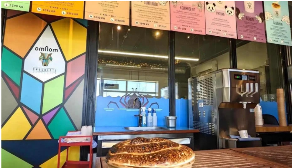
Omnom ísbud og sukkuladi verslun ísbuð