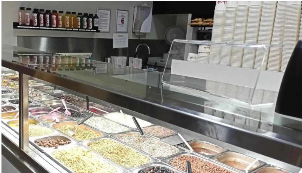
Isbud vesturbæjar staðsetning