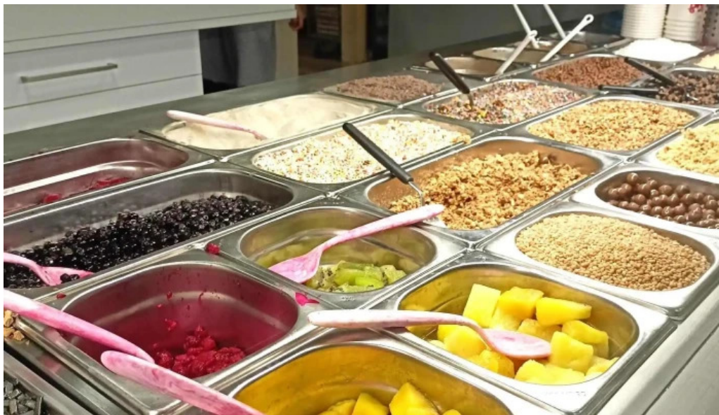
Isbud vesturbæjar instagram