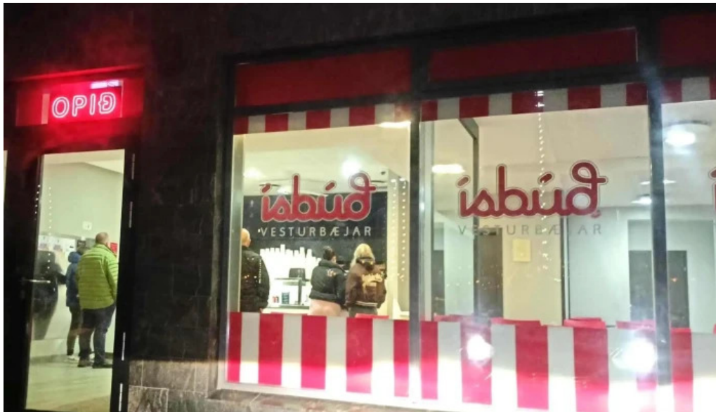
Isbud vesturbæjar myndir