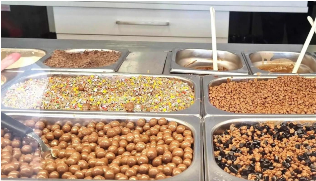
Isbud vesturbaejar numer