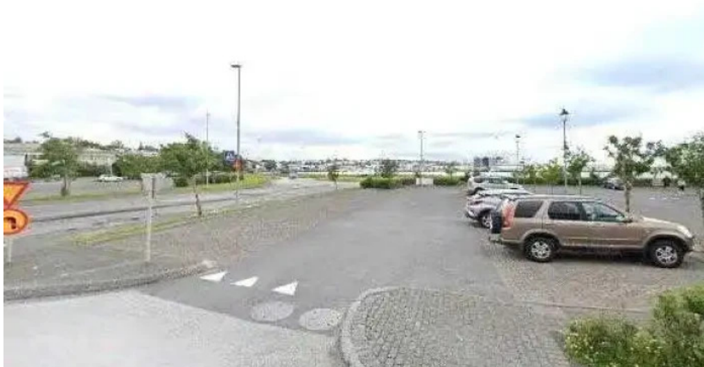
Isbud vesturbæjar street view 360deg