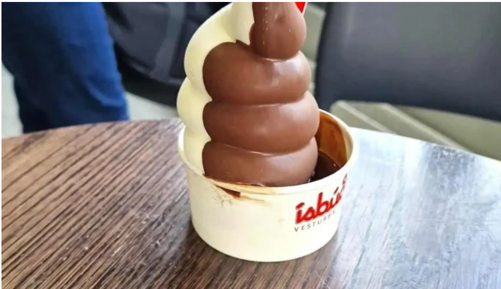
Isbud vesturbaejar rjonais