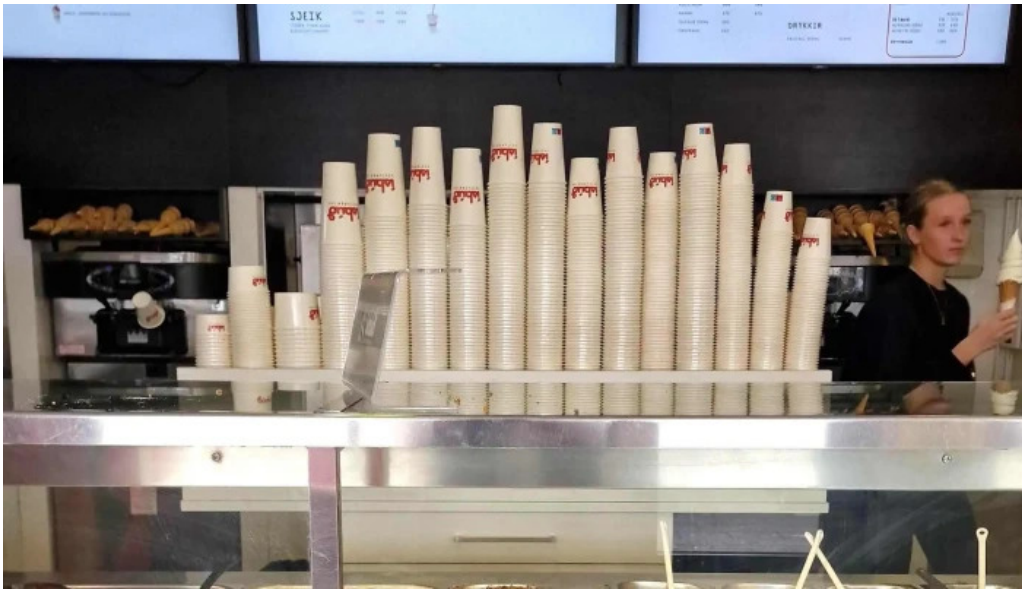
Isbud vesturbæjar hafnarfjörður