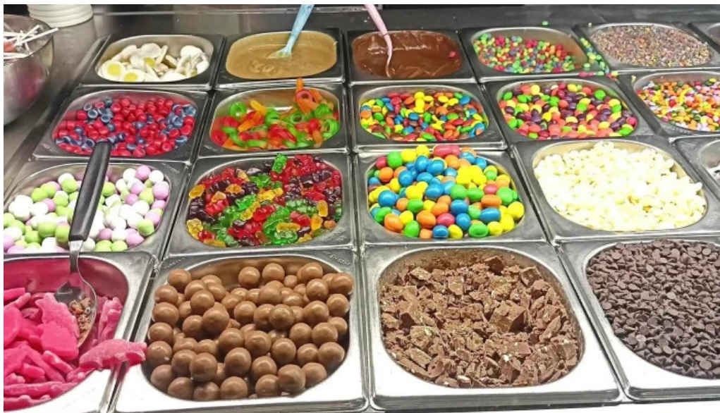
Isbud vesturbæjar safn