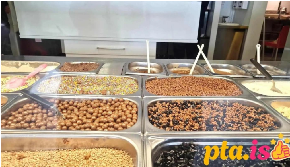
Isbud vesturbæjar matur og drykkur