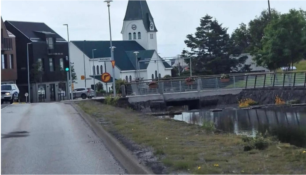
Isbud vesturbæjar hvar