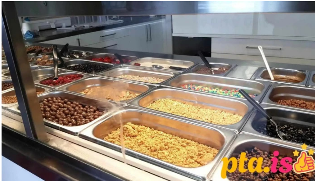
Isbud vesturbæjar isbuð