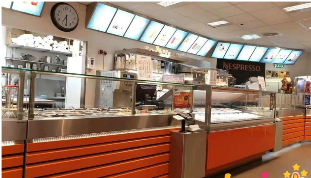
Ísbúðin garðabæ garðabær