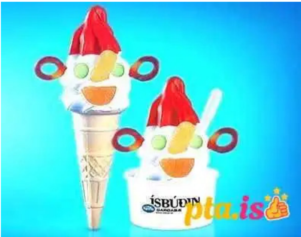
Isbudin gardabae fra eiganda