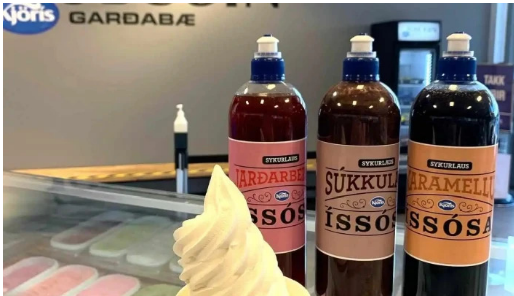
Isbudin gardabae matur og drykkur