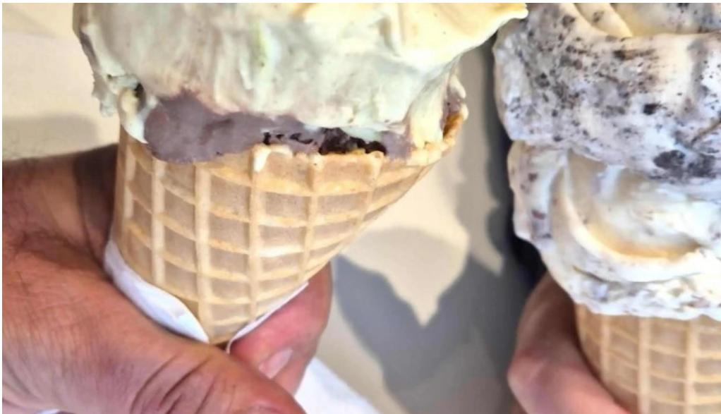
Isbudin gardabae garðabær