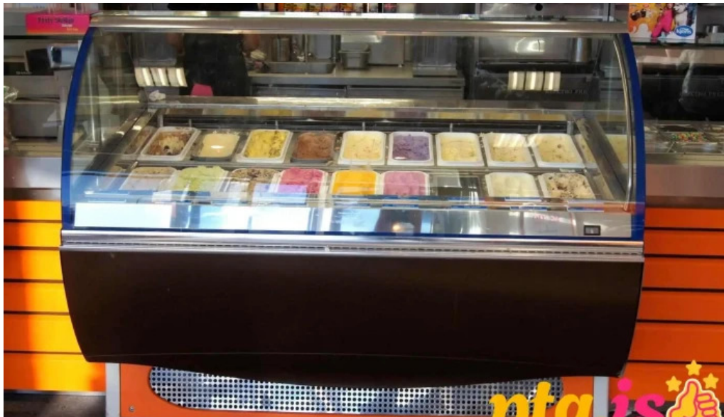
Isbudin gardabae rjomais