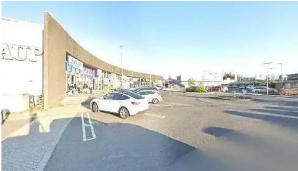
Isbudin gardabae street view 360deg