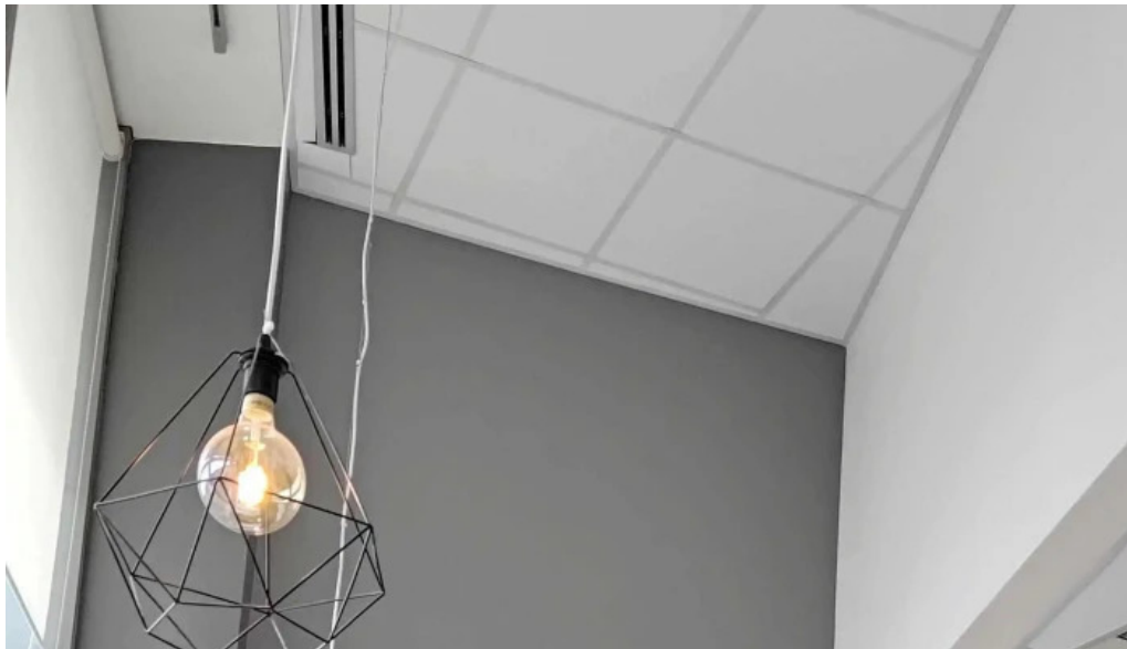
Isbudin gardabae vefsíða