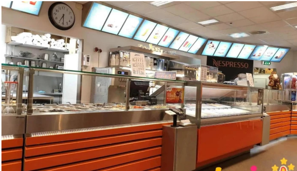
Isbudin gardabae isbuð