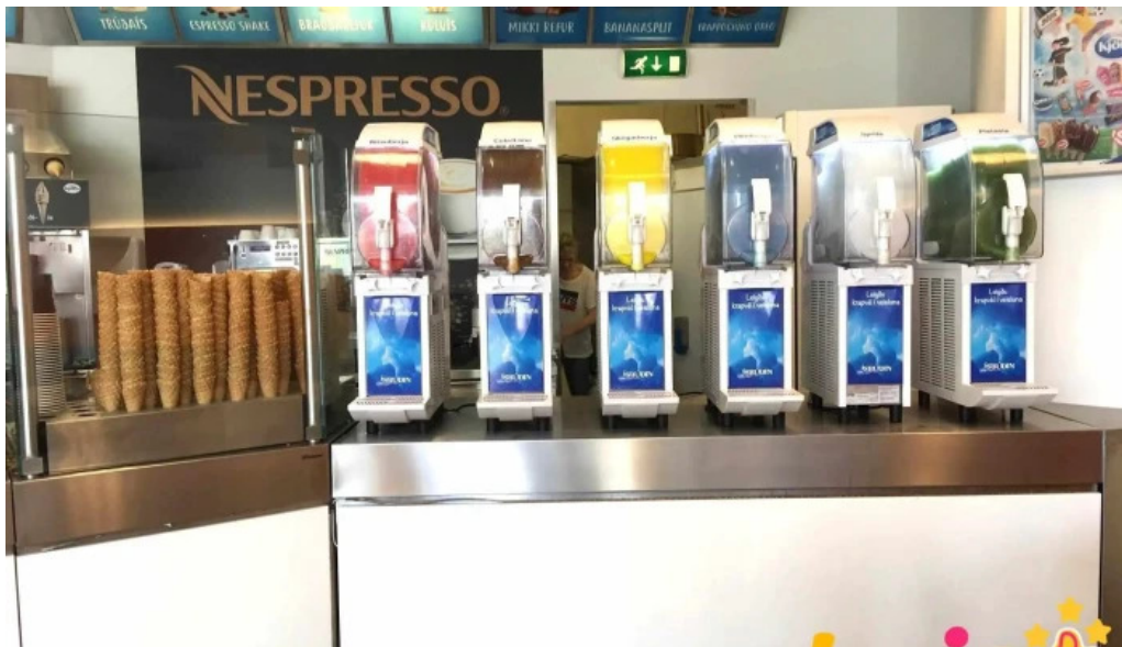
Isbudin gardabae stemning