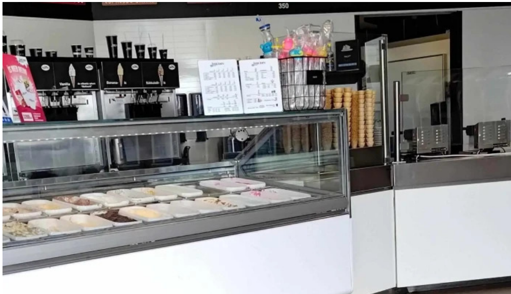
Isbudin gardabae verð