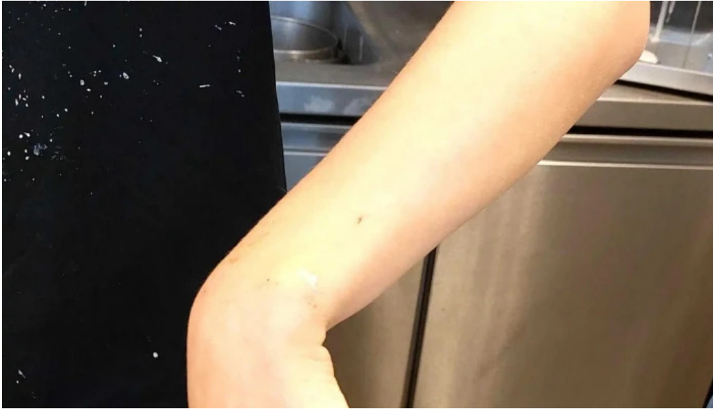
Isbudin gardabae hvernig a að komast þangað