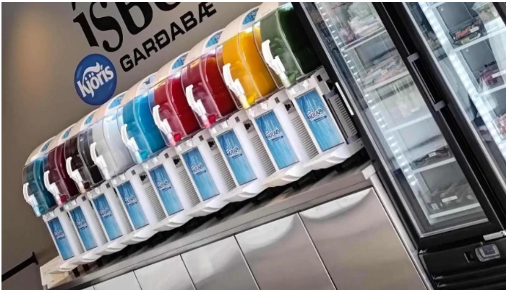
Isbudin gardabae hvar