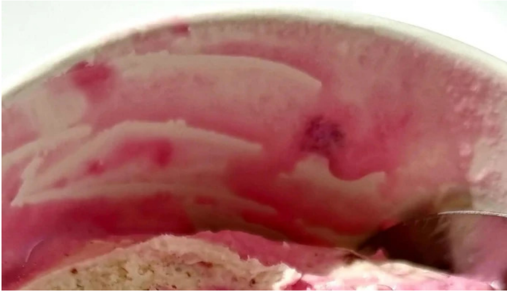
Isbudin gardabae athugasemdir