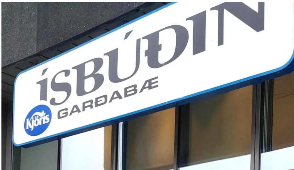
Isbudin gardabae staðsetning