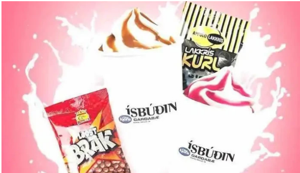
Isbudin gardabae matsedill