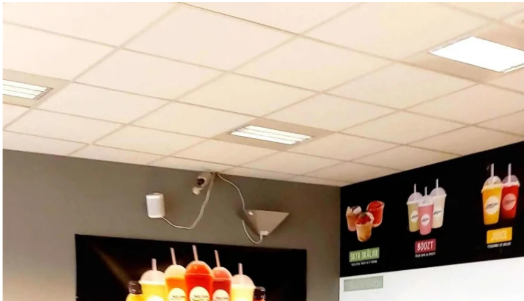
Isbudin gardabae myndbond