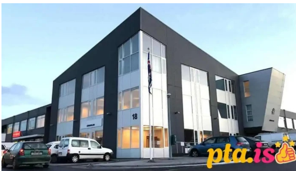
Utlendingastofnun fra eiganda