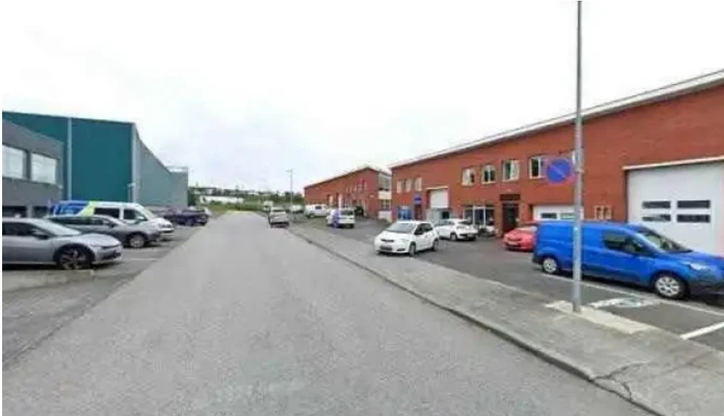
Utlendingastofnun street view 360