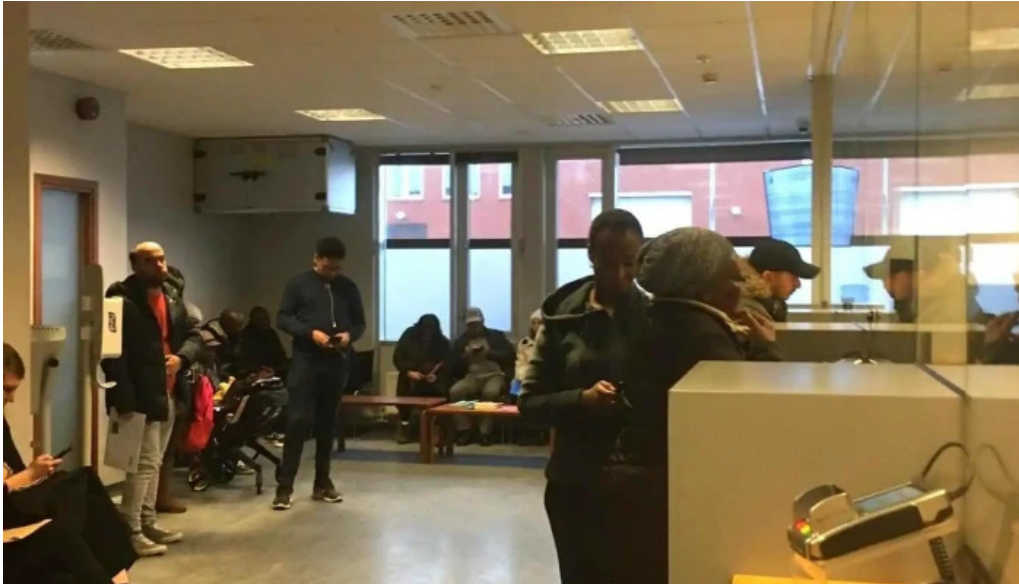
Utlendingastofnun ad innan