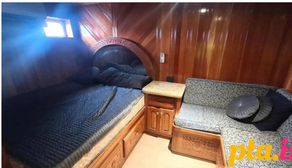
Sea trips reykjavik ad innan