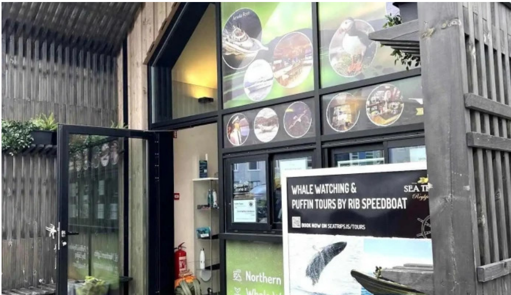
Sea trips reykjavik naerumhverfi