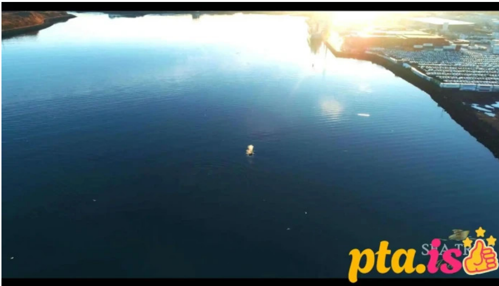
Sea trips reykjavik fra eiganda