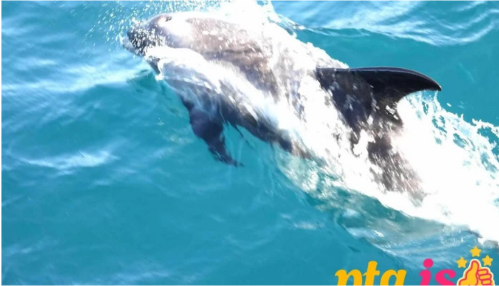
Sea trips reykjavik hofrungrar