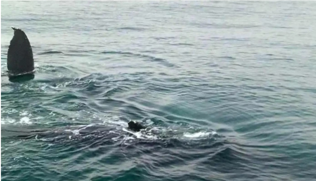
Sea trips reykjavik myndskoid