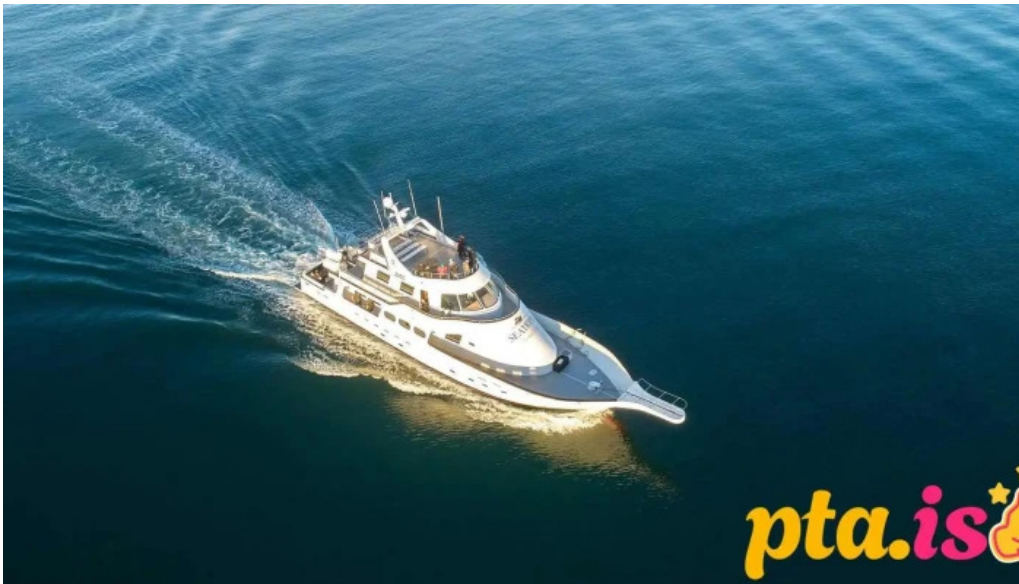
Sea trips reykjavik hvalaskoðunarfyirtæki