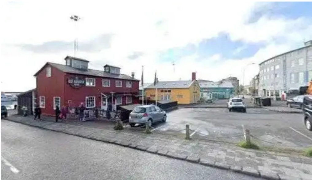
Sea trips reykjavik street view 360