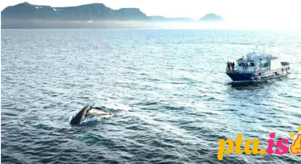
Sjoferdir fra eiganda