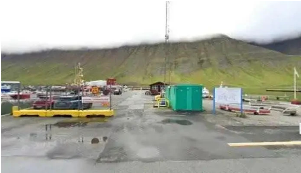
Sjoferdir street view 360deg