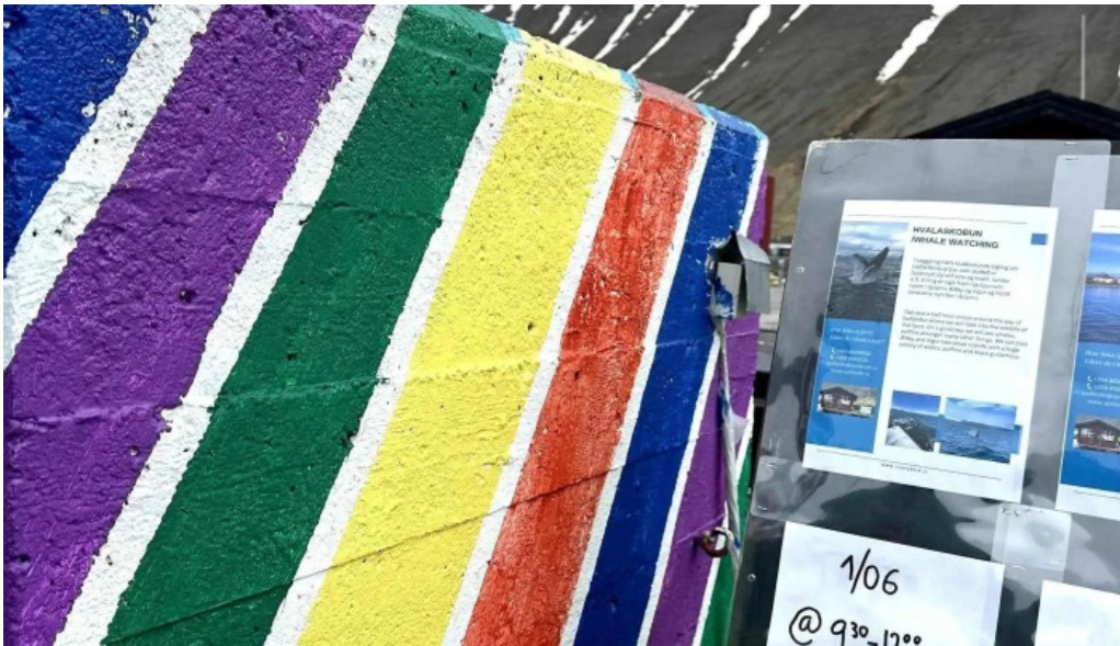
Sjoferdir hvernig a að komast þangað