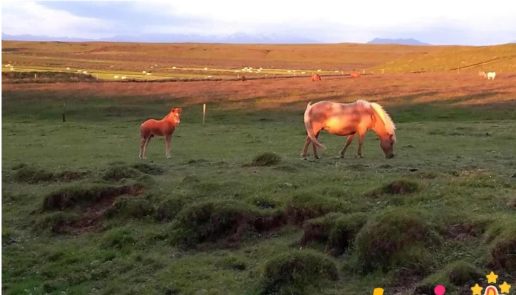
Thjodolfshagi 1 hestur