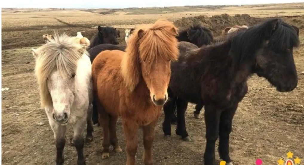
Þjóðólfshagi 1 rauðilækur