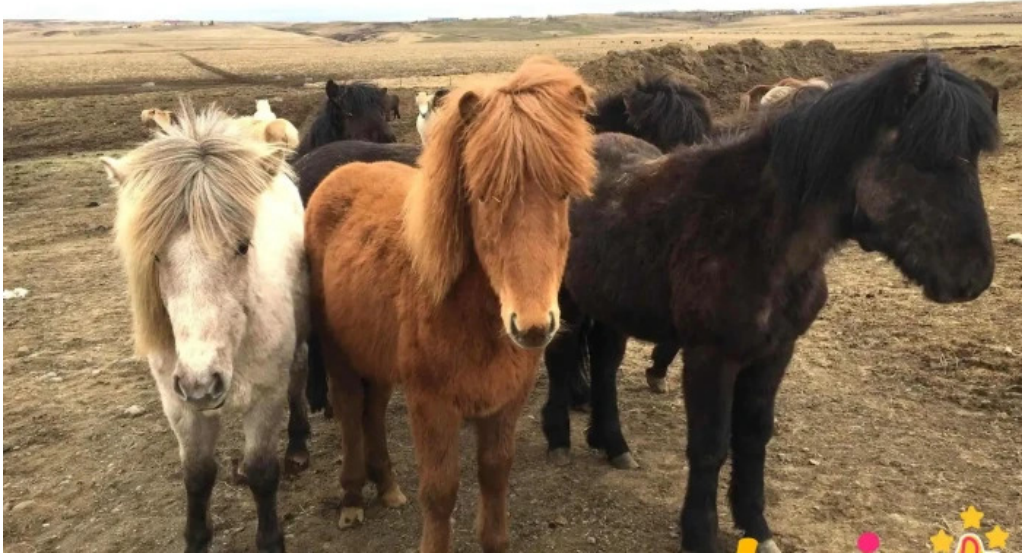
Thjodolfshagi 1 hrossaræktandi