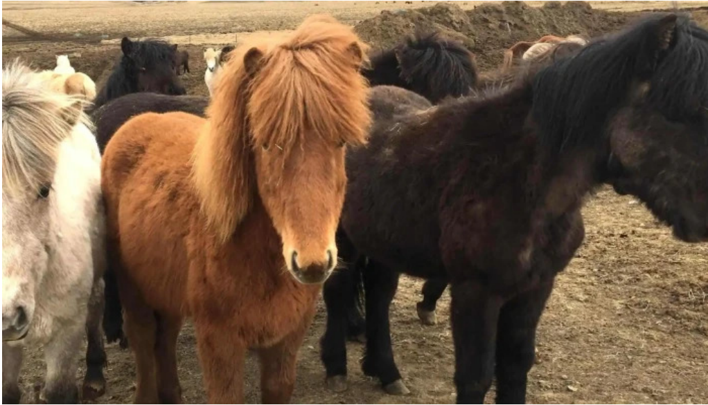
Thjodolfshagi 1 rauðilækur