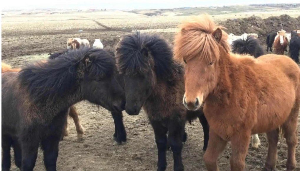
Þjóðólfshagi 1 safn