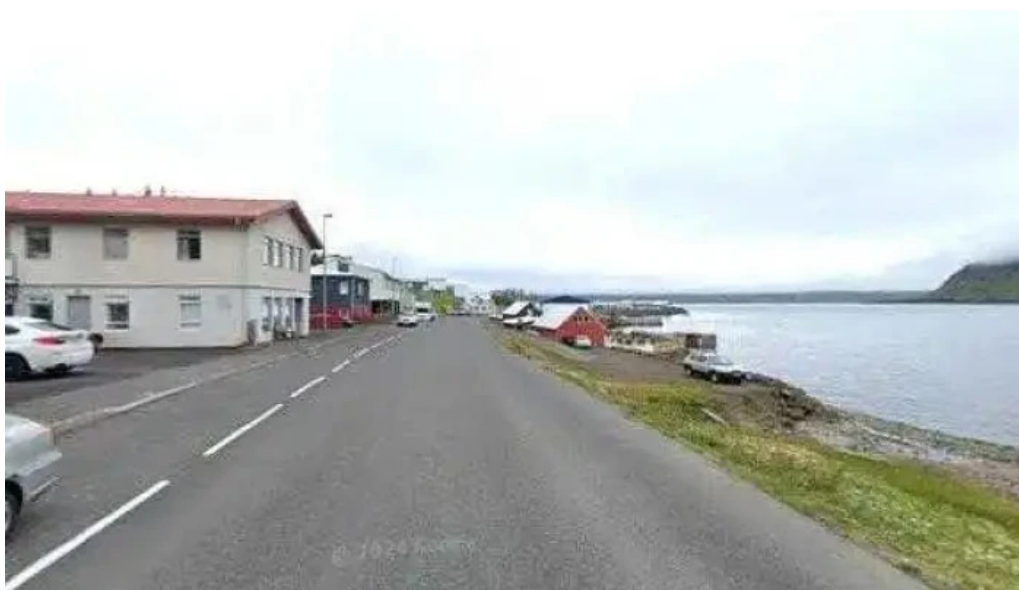
Sparisjóður norðfjarðar street view 360deg