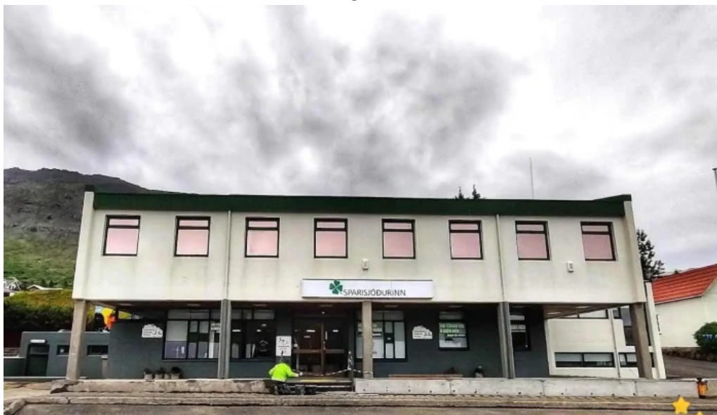
Sparisjóður norðfjarðar neskaupstaður