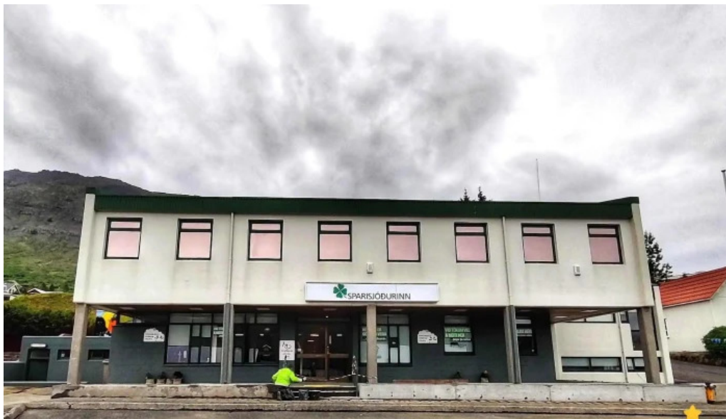
Sparisjodur nordfjardar hraðbanki