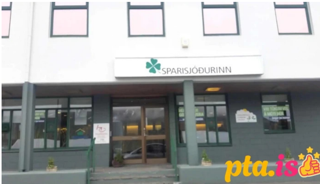
Sparisjodur nordfjardar naerumhverfi