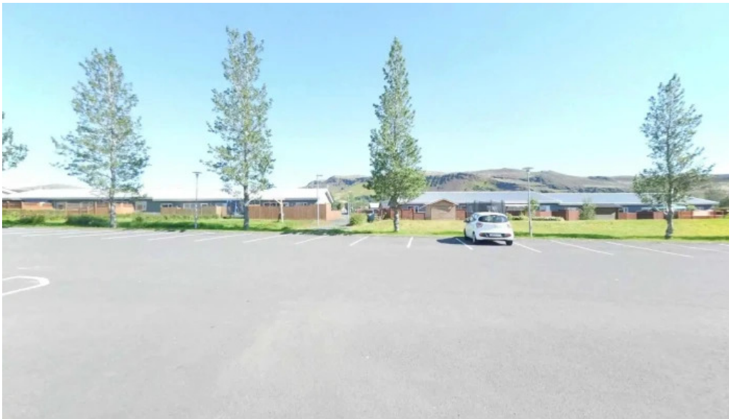
Hotel ork street view 360deg