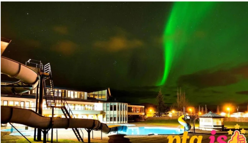
Hotel ork hotel