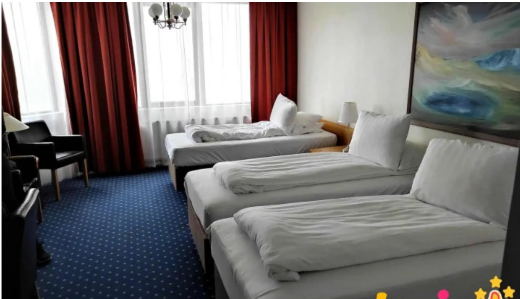
Hotel ork fra gestum