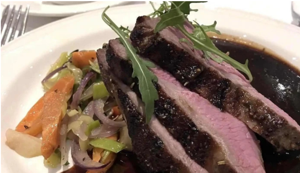
Hotel ork matur og drykkur