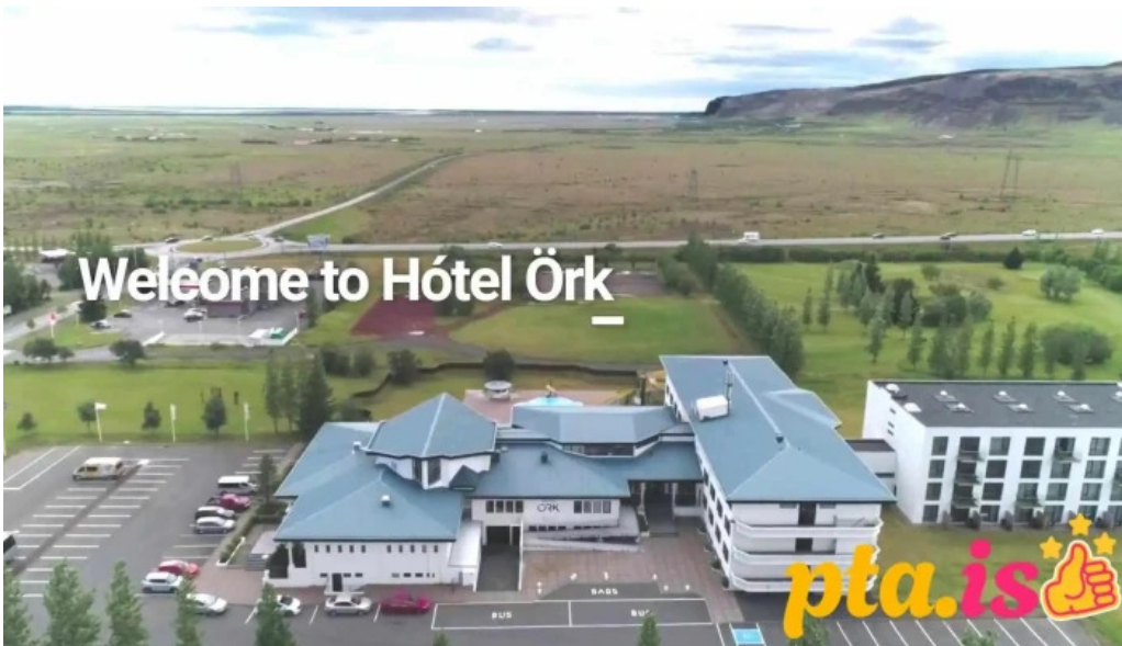
Hotel ork naerumhverfi