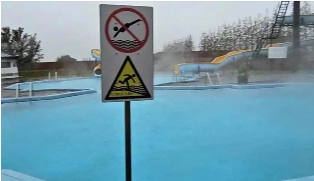
Hotel ork myndskeid