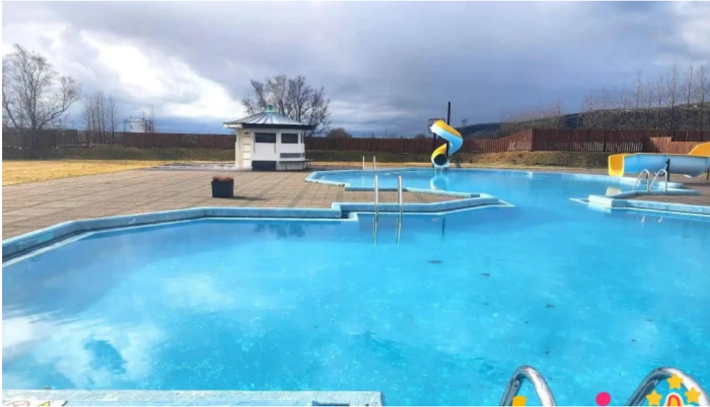
Hotel ork nyjast