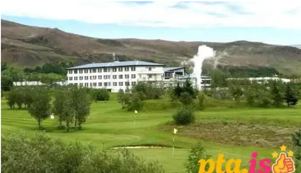
Hotel ork hveragerði