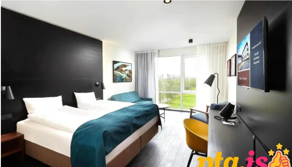
Hotel ork herbergj