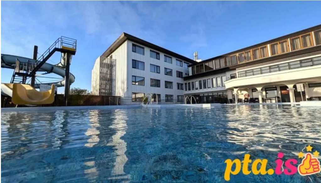
Hotel ork thjonusta