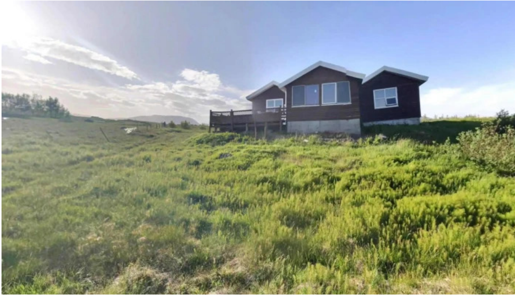
Uthlid cottages street view 360deg