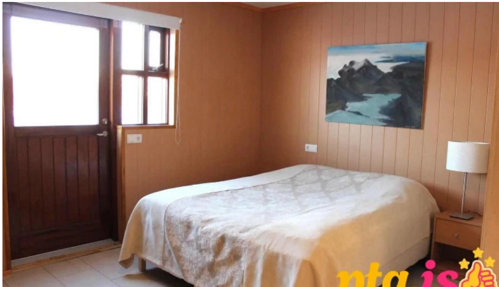
Uthlid cottages herbergi