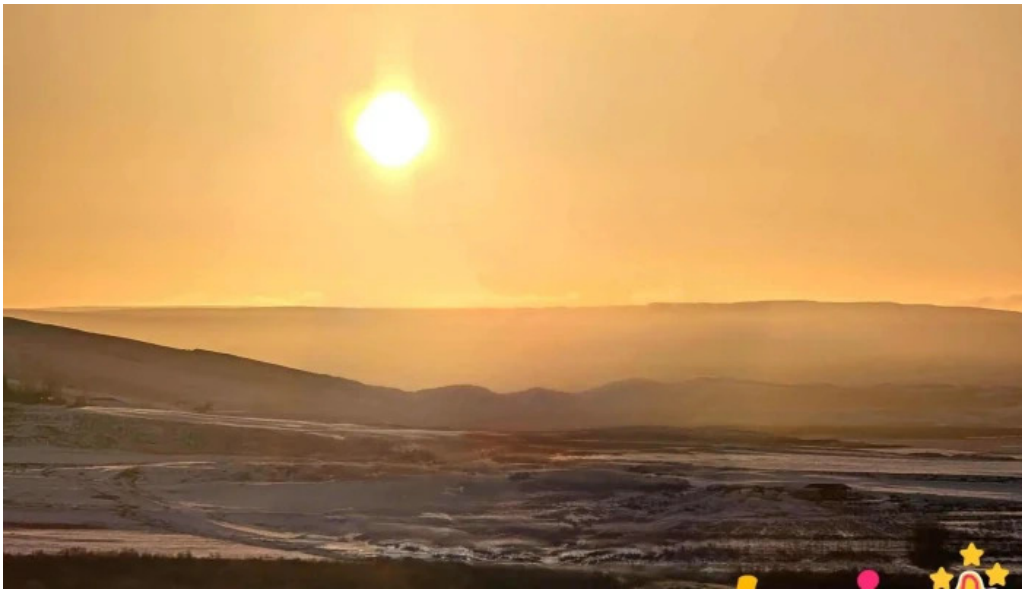
Uthlid cottages nyjast