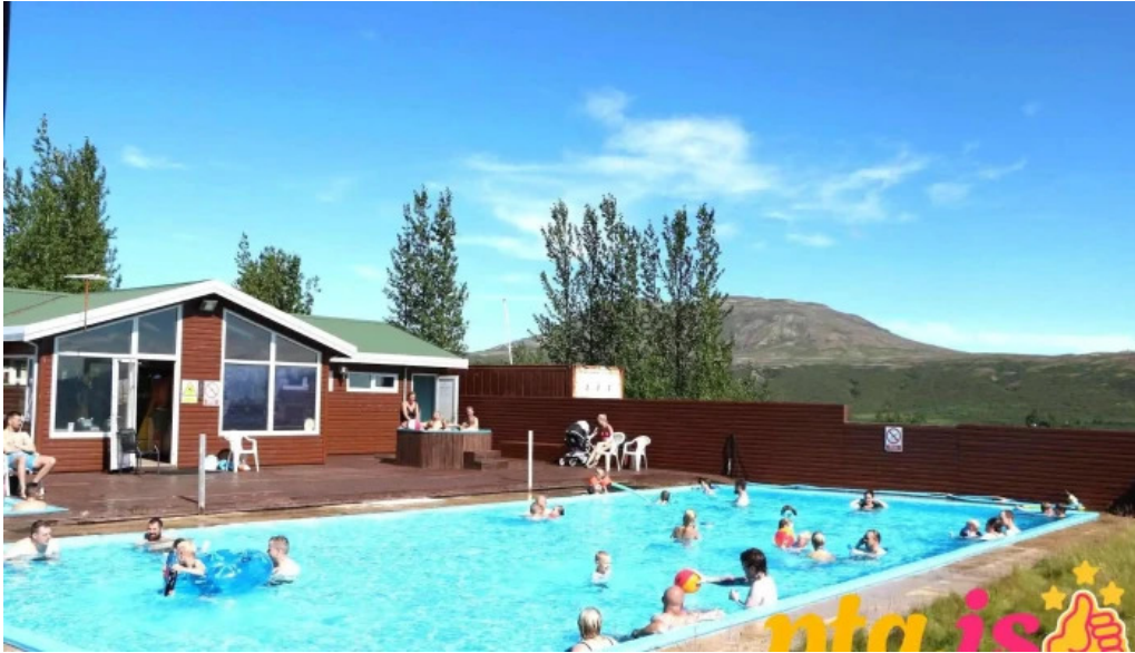
Uthlid cottages naerumhverfi