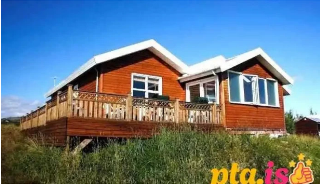
Uthlið cottages blaskogarbyggd