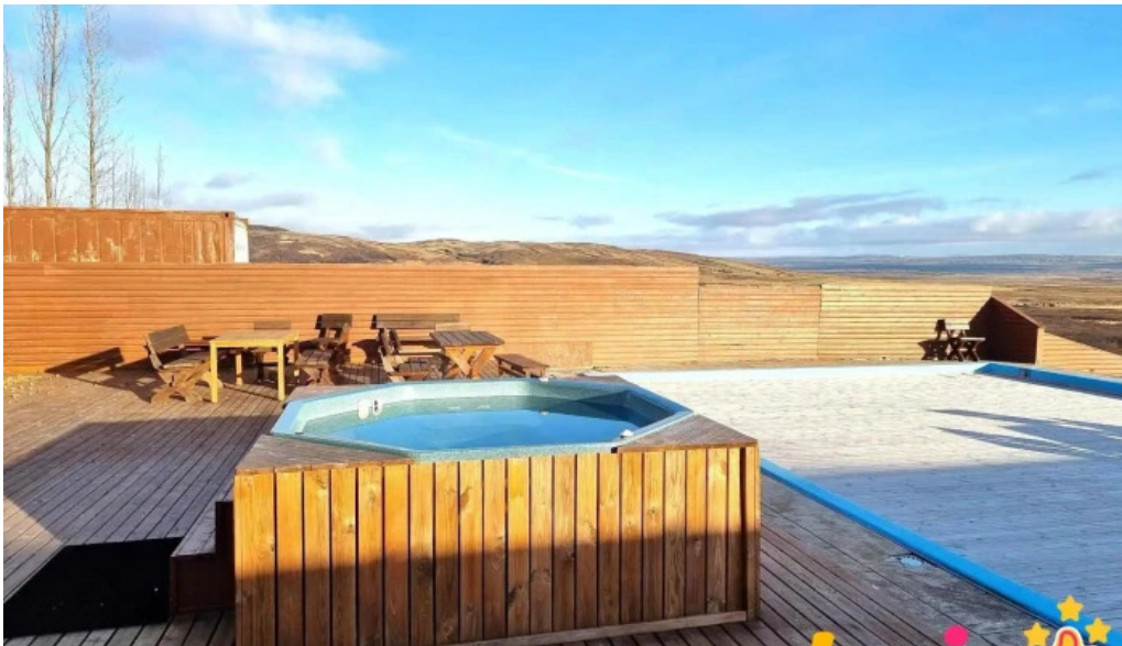
Uthlid cottages thjonusta