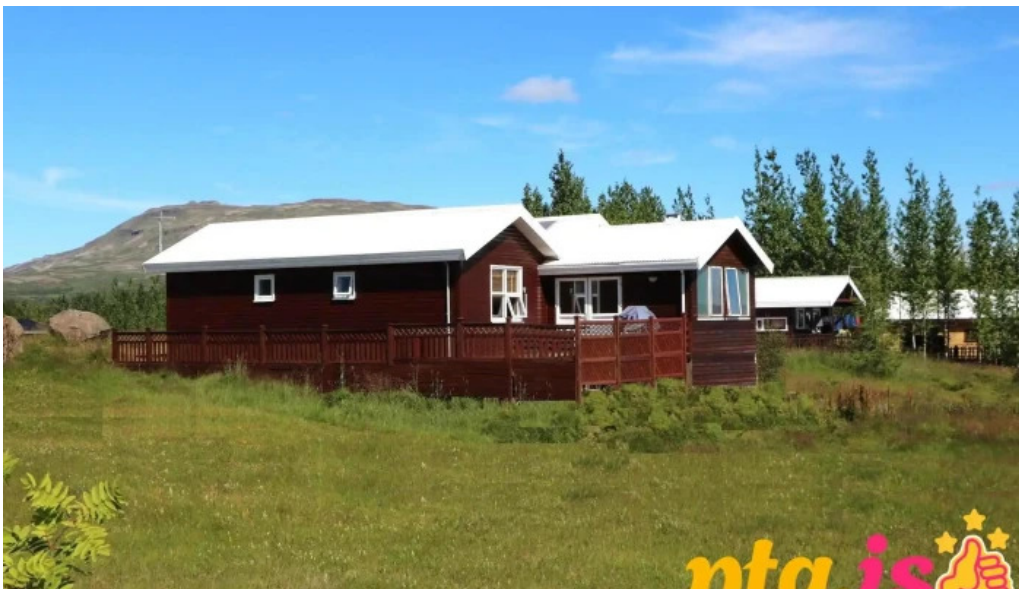
Uthlid cottages hotel