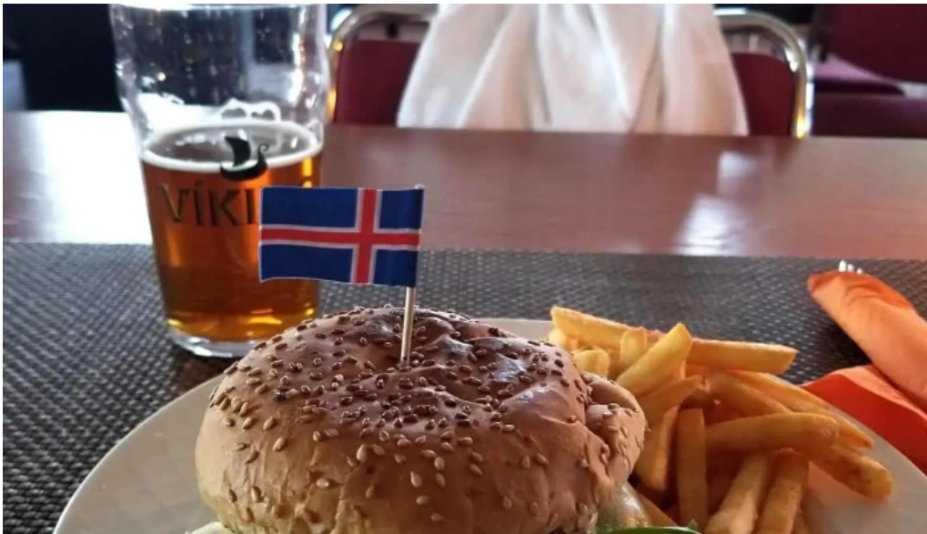
Uthlid cottages matur og drykkur