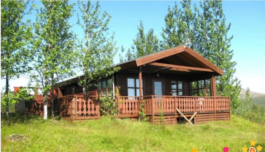
Uthlid cottages fra eiganda