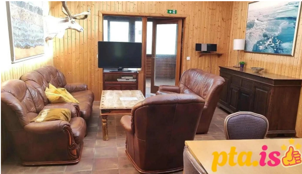
Uthlid cottages myndskeld