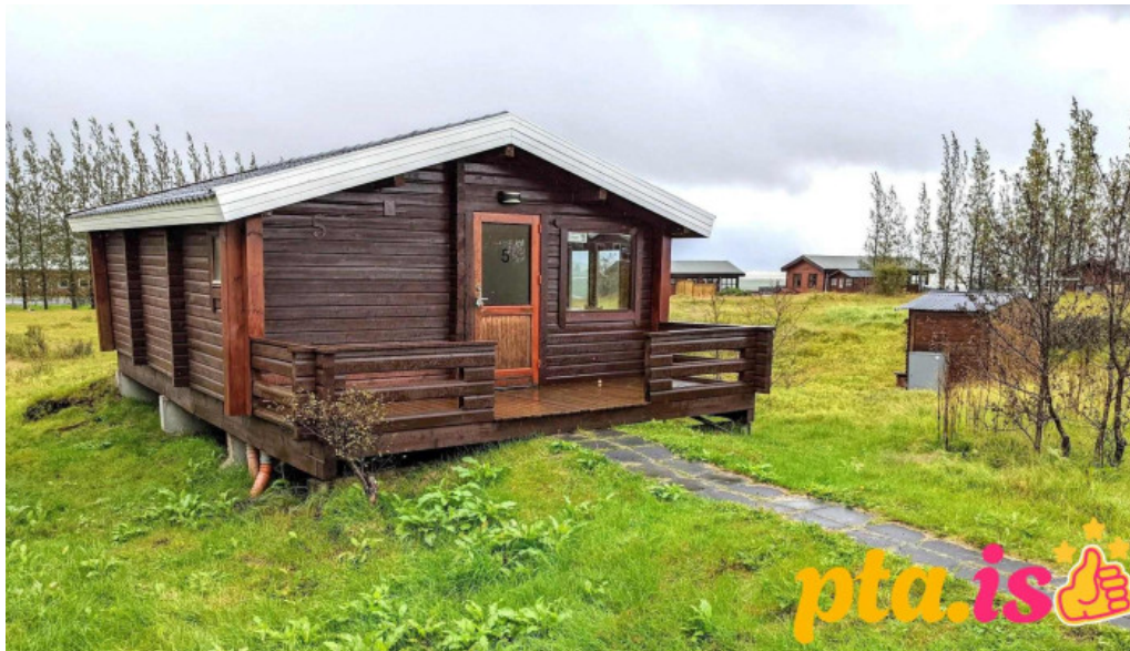
Uthlid cottages fra gestum