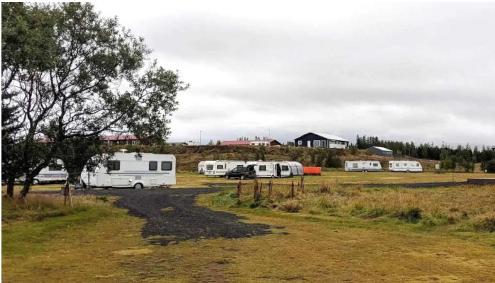
Borg grimsnes grafningshreppur stoppustud orkusalan klausturholar