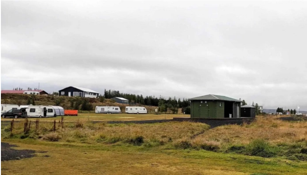
Borg grimsnes grafningshreppur stoppustud orkusalan safn