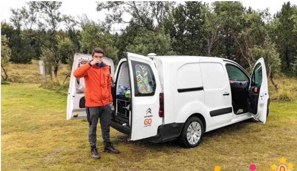
Borg grimsnes grafningshreppur stoppustuð orkusalan klausturholar