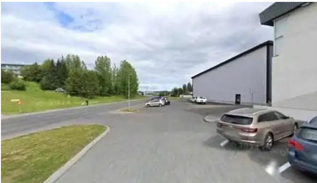
Fljotsdalsherað stoppustud orkusalan hleðslustuð rafbila