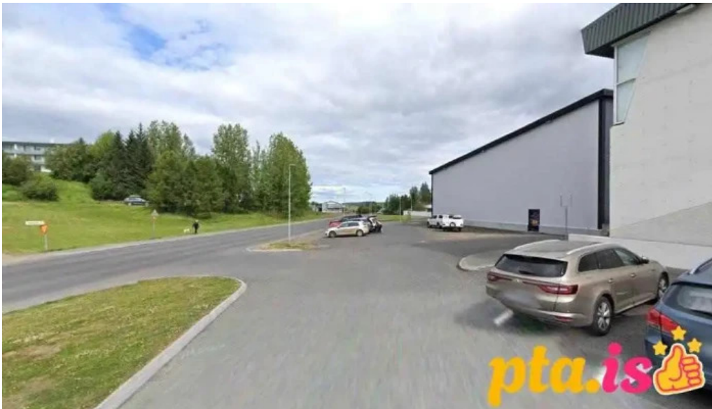
Fljotsdalsherað stoppustuð orkusalan egilsstaðir