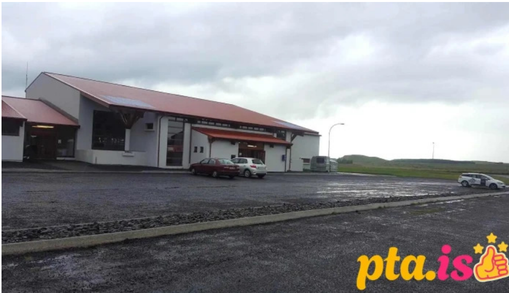
Stoppu stud asahrepps laugalandi hleðslustoð rafbila