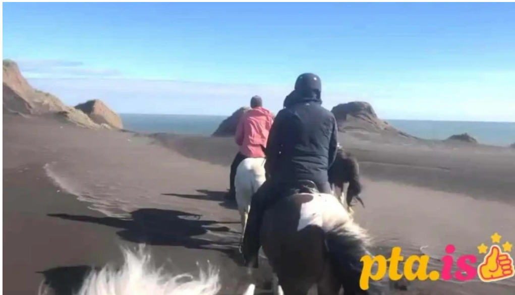
Alhestar fra eiganda