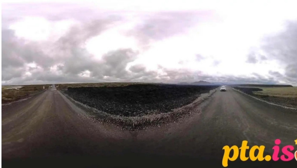
Naval radio transmitter facility grindavik grindavik