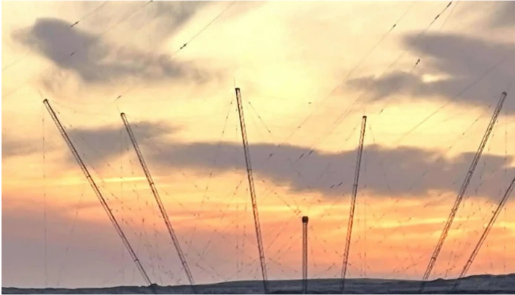
Naval radio transmitter facility grindavik grindavik