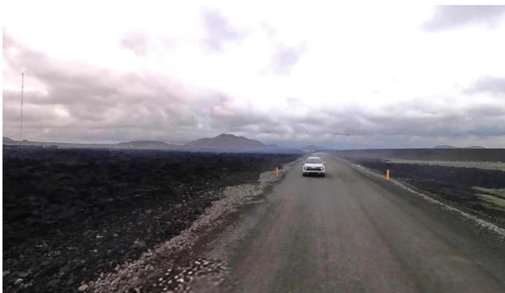
Naval radio transmitter facility grindavik herstoð