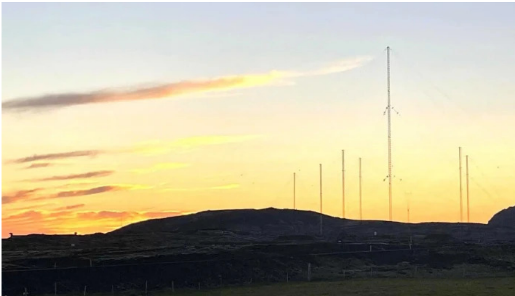
Naval radio transmitter facility grindavik ætlun