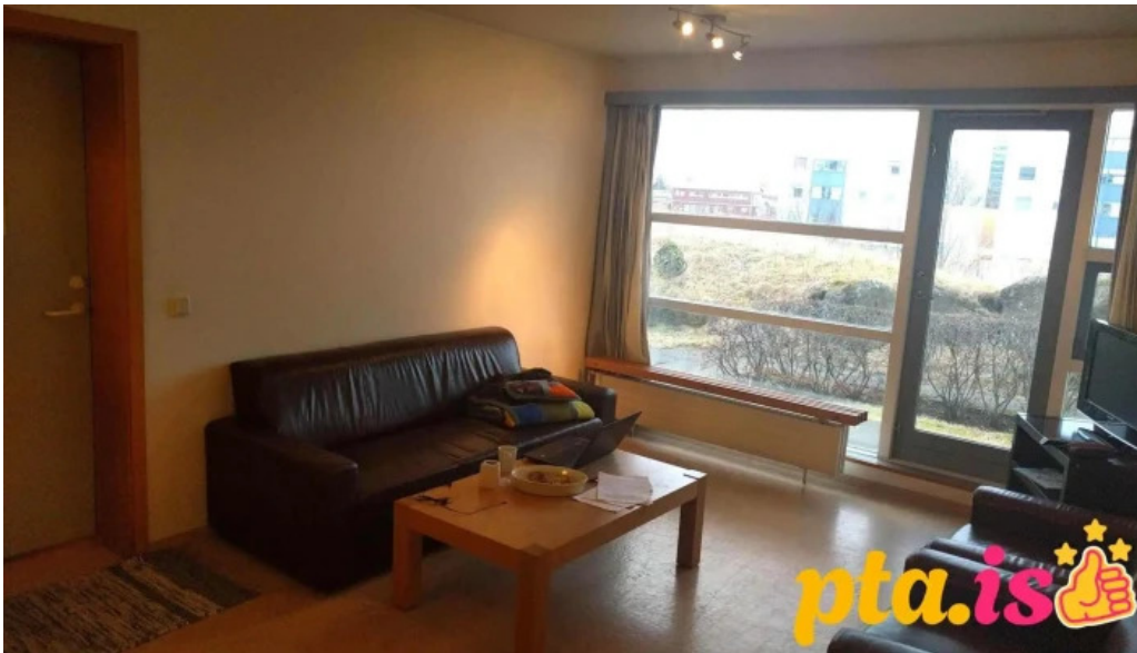
Skerjagardur fra gestum