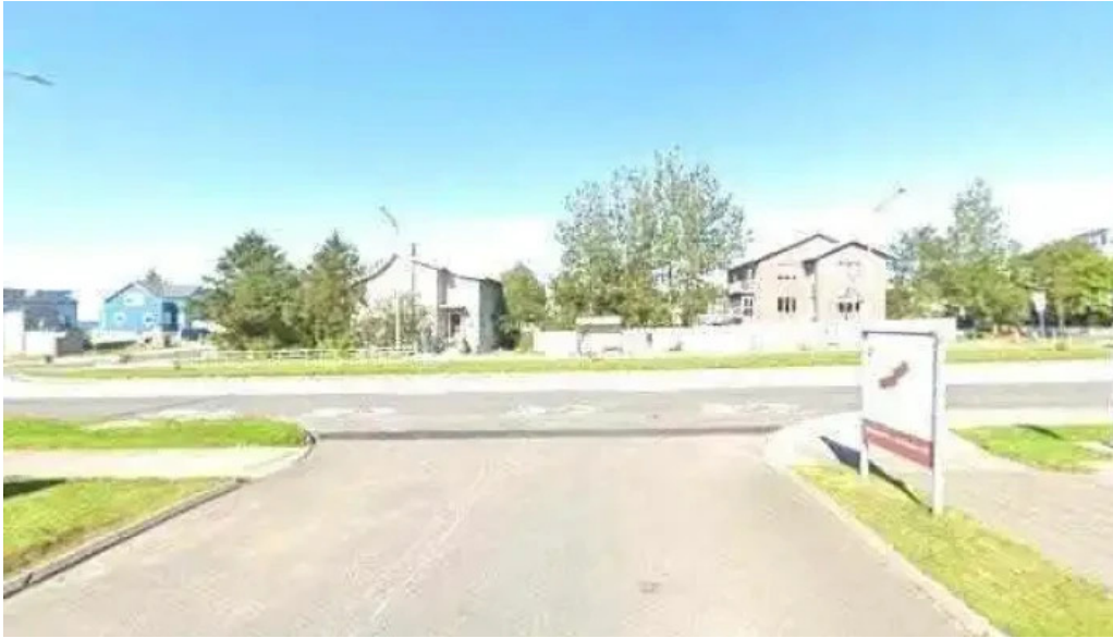
Skerjagardur street view 360deg