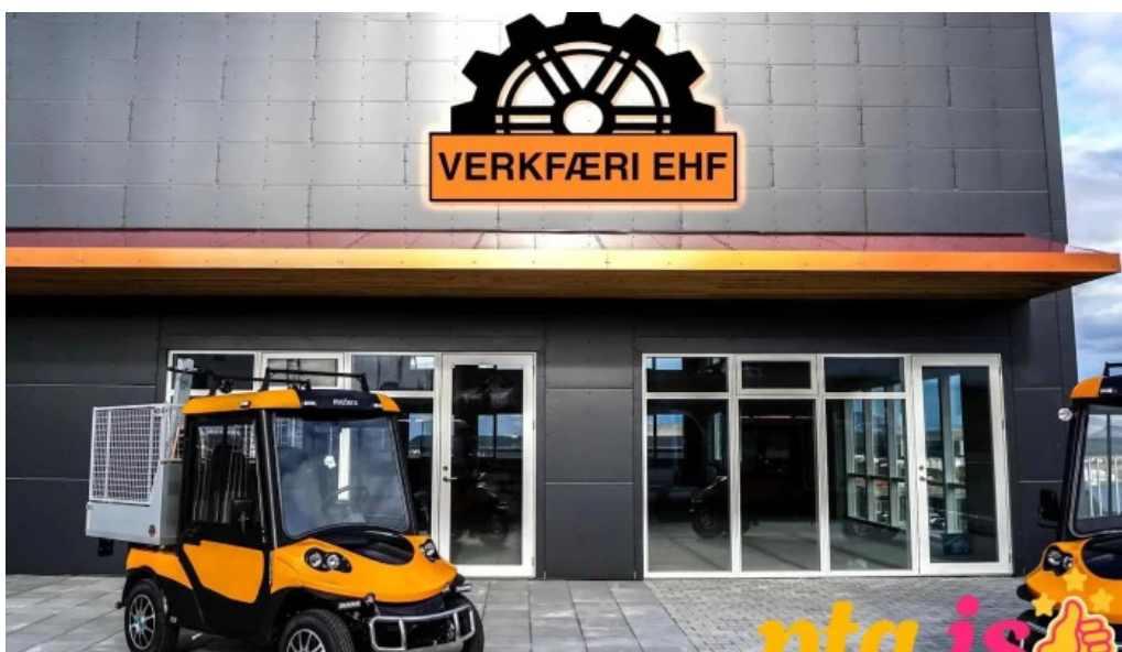
Bugðuflijt 11 mosfellsbaer heildsali