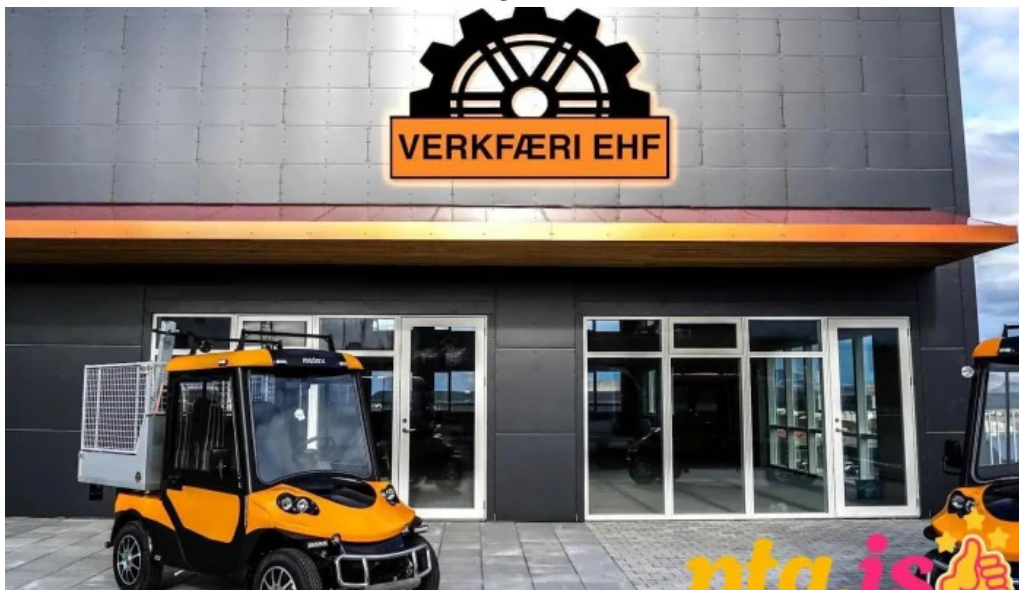
Bugðuflijt 11 mosfellsbær mosfellsbær