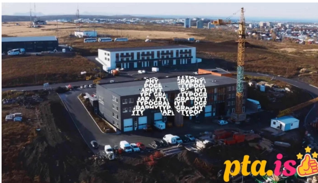
Bugdufljót 11 mosfellsbær fra eiganda