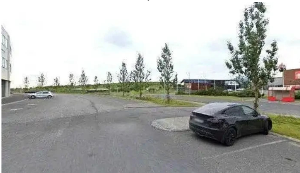
Sjúkratryggingar íslands street view 360deg