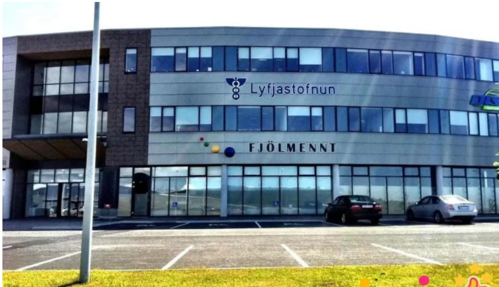
Sjúkratryggingar islands reykjavik