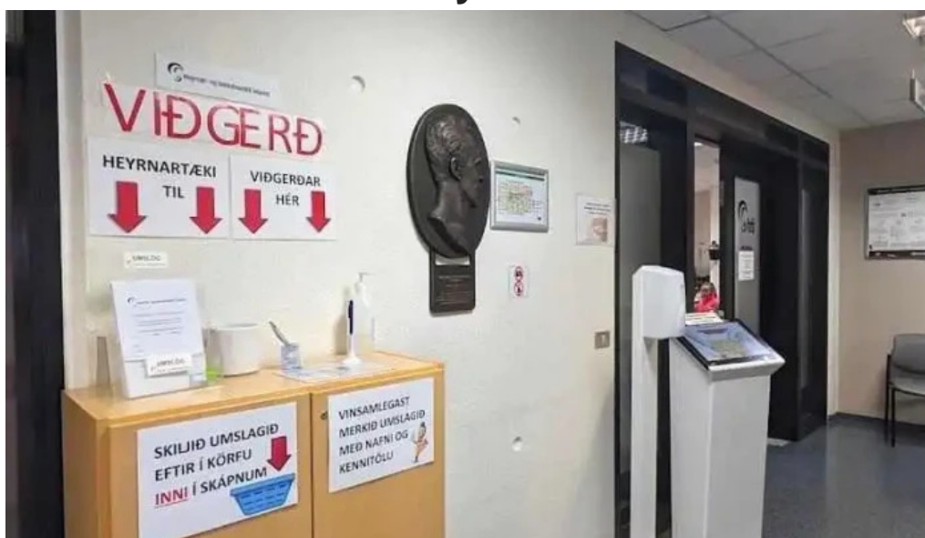
Heyrnar og talmeinastöð Íslands Reykjavík