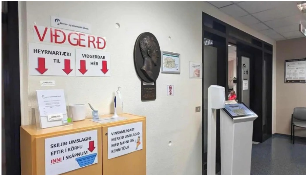
Heyrnar og talmeinaostod islands heilbrigðiseftirlit