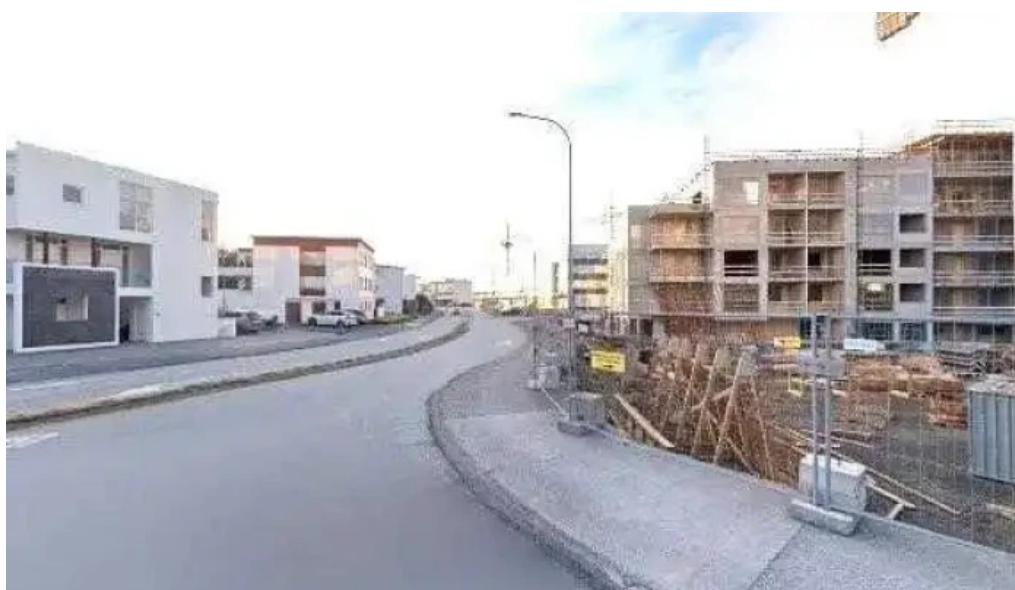
Heyrnar og talmeinastöð Íslands street view 360deg