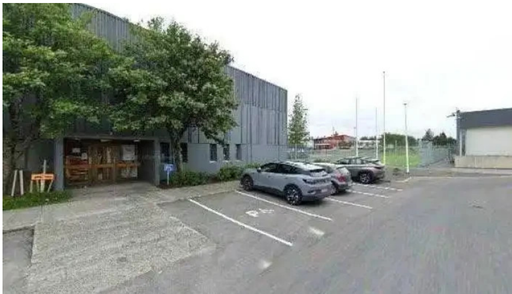
Gardaskoli street view 360deg