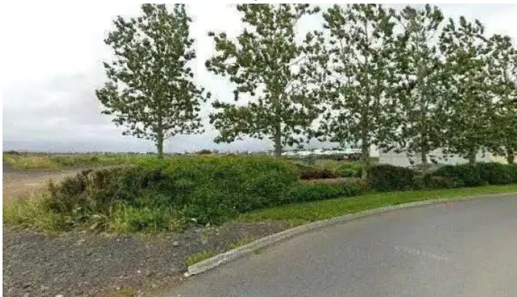
Hádegishólar street view 360deg