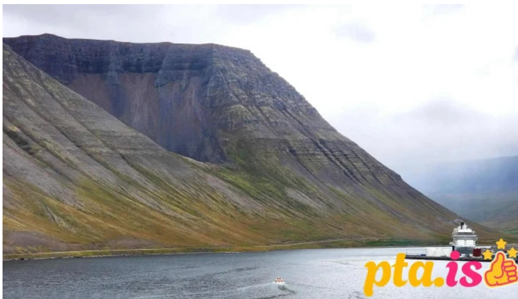
Naustahvilft the troll seat isafjörður