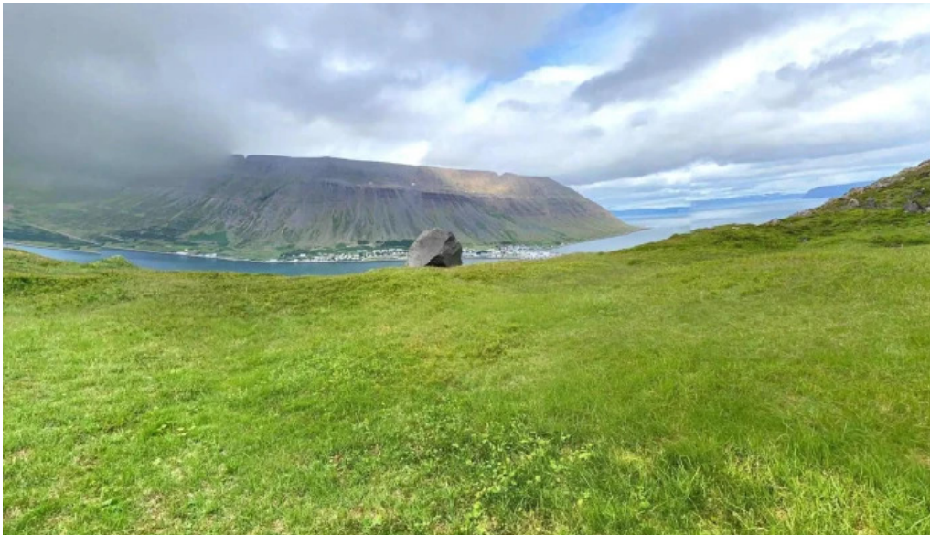
Naustahvilft the troll seat street view 360