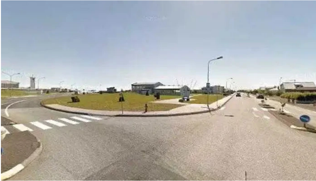
Grindavik volcano street view 360