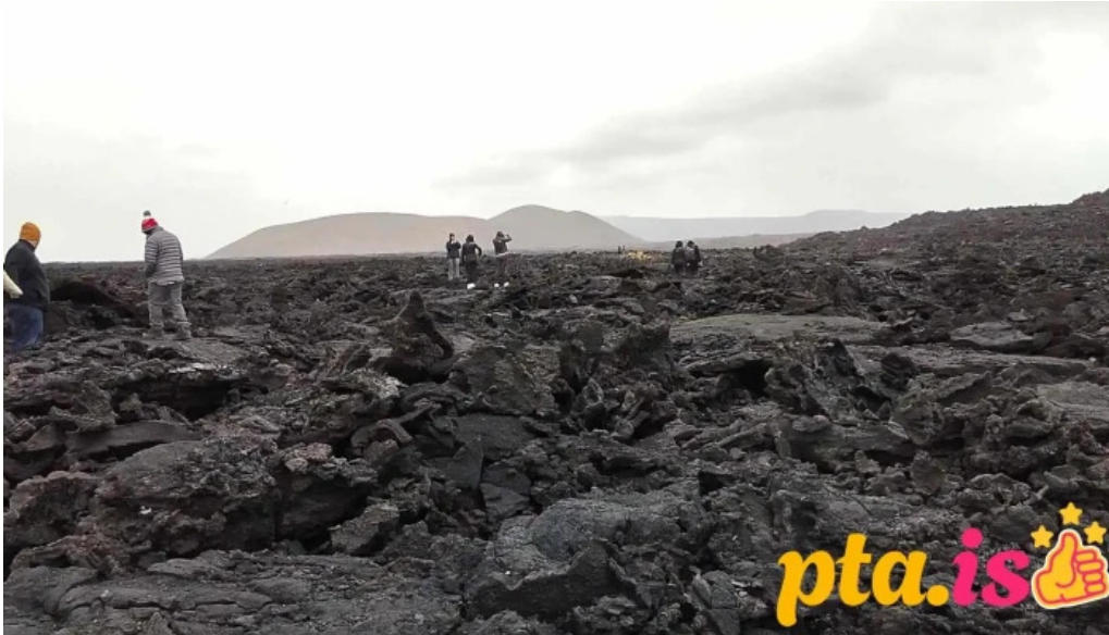
Grindavik volcano myndskleid