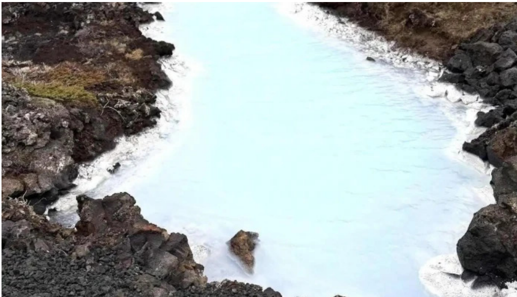
Grindavik volcano nyjast