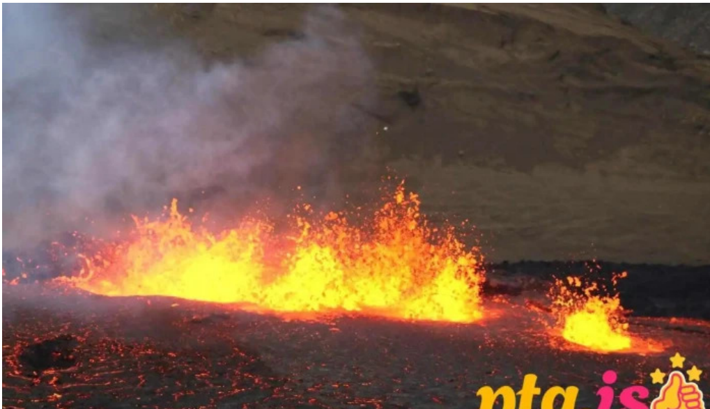
Grindavik volcano grindavik