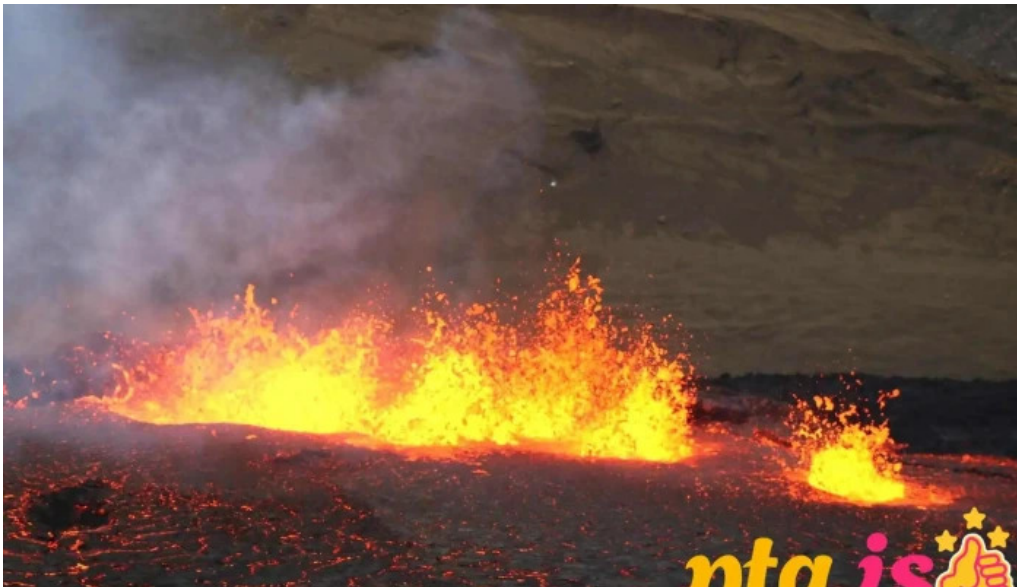
Grindavík volcano gongusvæði