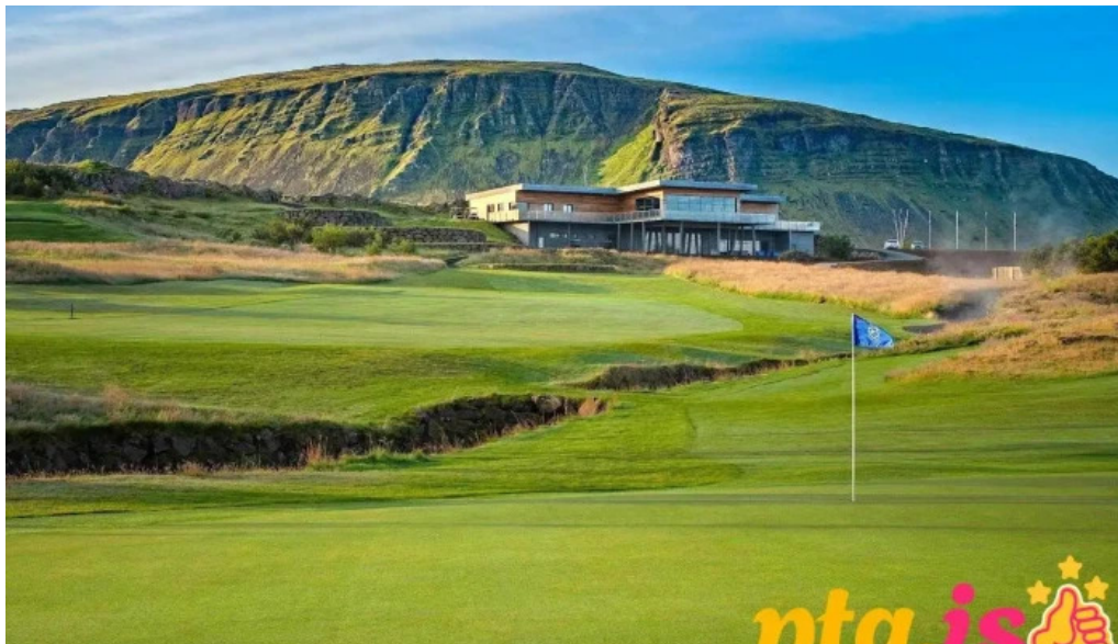
Golfklubbur mosfellsbæjar mosfellsbær