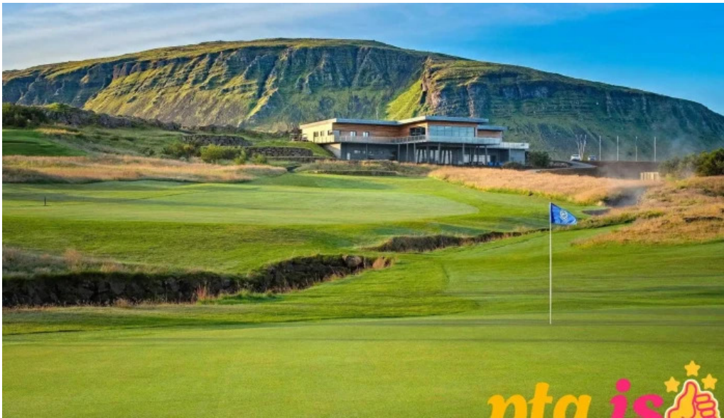
Golfklubbur mosfellsbaejar golfklubbur