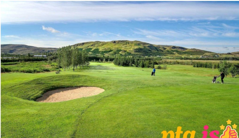
Golfklubbur mosfellsbaejar fra eiganda