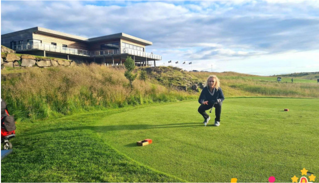
Golfklubbur mosfellsbaejar landslag