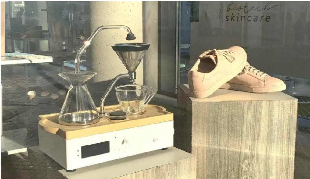
Nomad fra eiganda