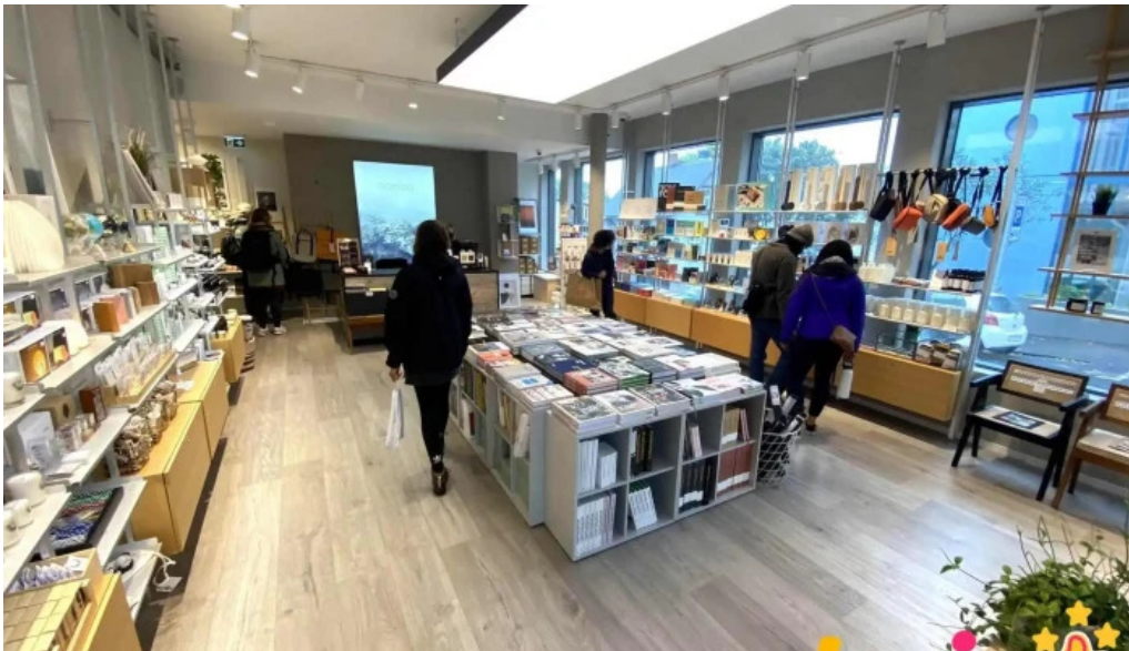
Nomad ad innan