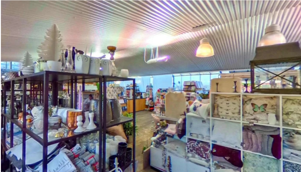
Rosagardurinn ad innan