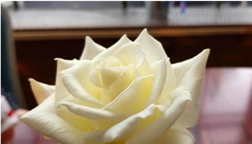
Rosagardurinn fra eiganda