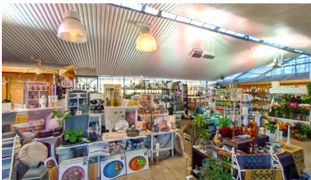
Rosagardurinn street view 360deg