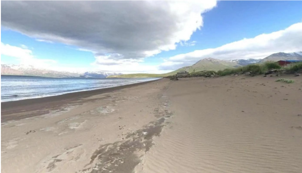
Prydi harverkstaedid gjafavoruverslun