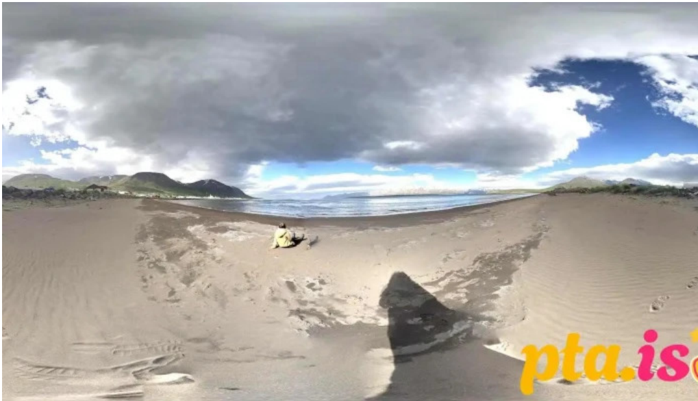
Prýði harverkstæðið dalvik