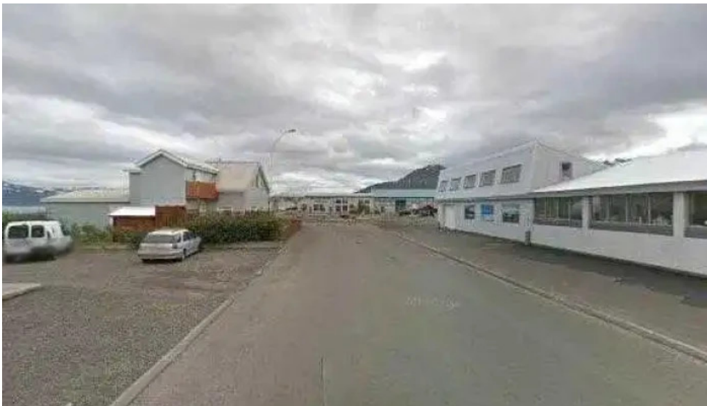
Prýði harverkstaedid street view 360deg