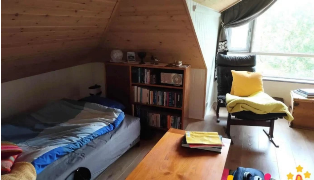
Frostastadir gistihus herbergi