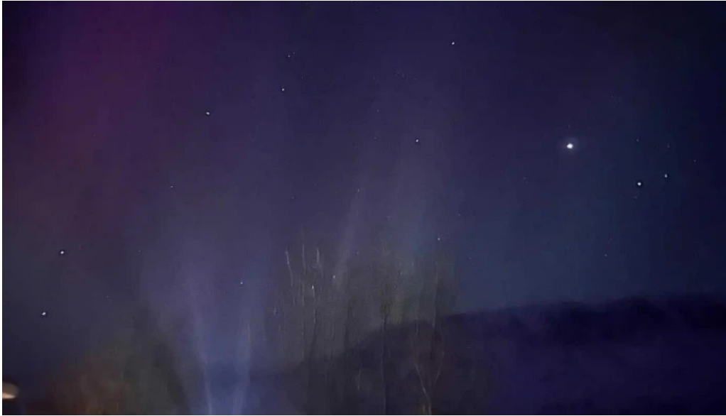
Frostastadir gistihus fra gestum