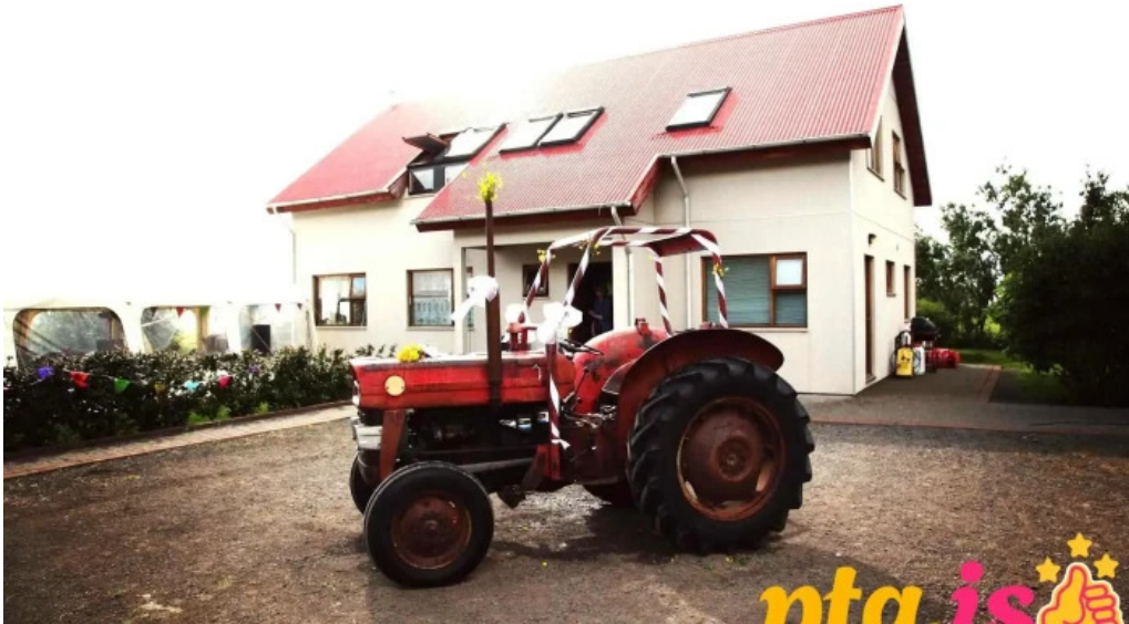
Frostastadir gistihus gististaður