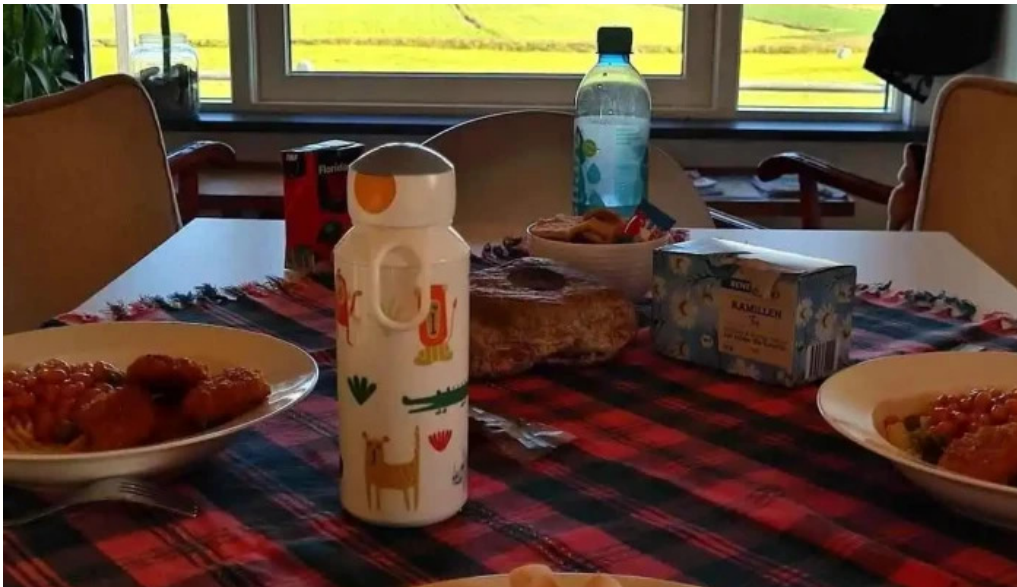
Frostastadir gistihus matur og drykkur