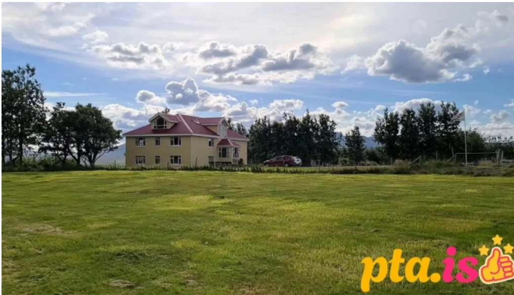
Frostastadir gistihus myndskeld