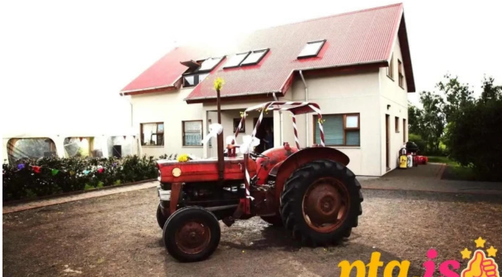
Frostastaðir gistihus varmahlið