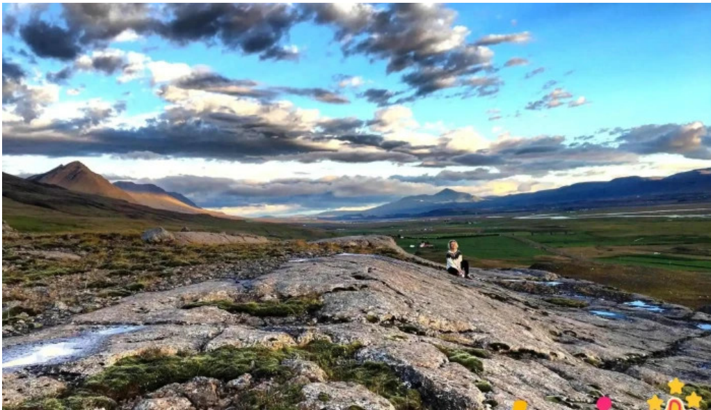
Frostastadir gistihus fra eiganda