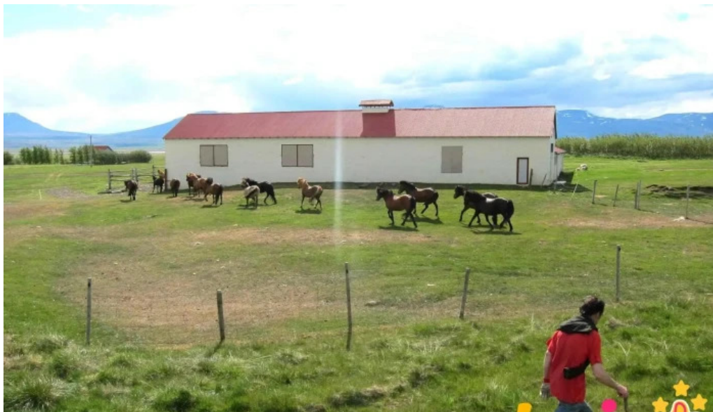
Frostastadir gistihus naerumhverfi