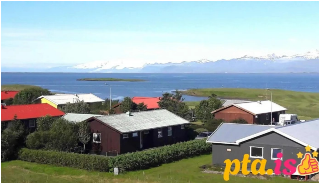
Hofn hi hostel fra gestum