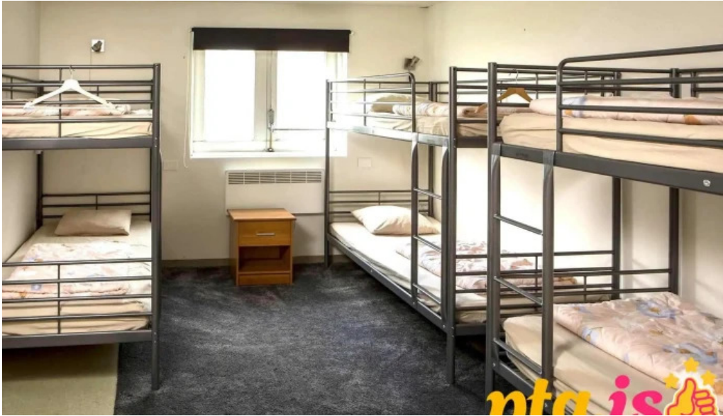
Hofn hi hostel herbergi