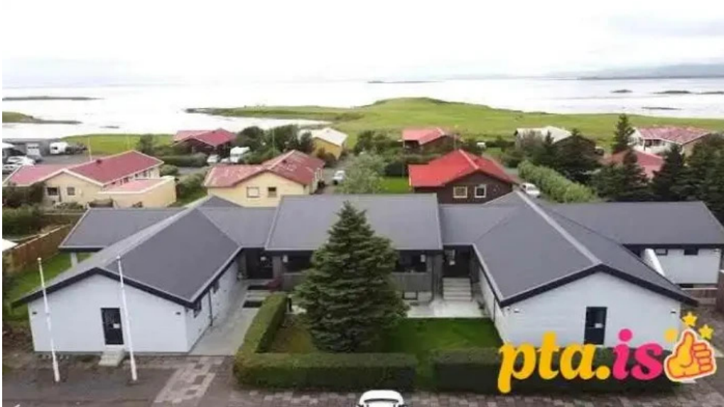
Hofn hi hostel hofn i hornafirði