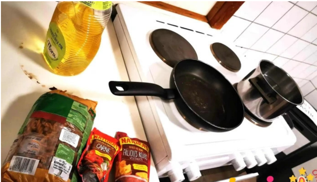
Hofn hi hostel matur og drykkur