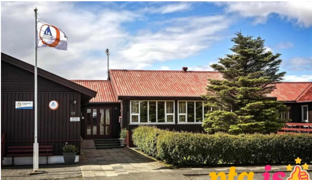
Hofn hi hostel gististaður