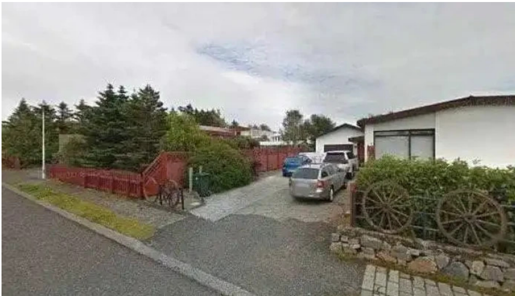
Hofn hi hostel street view 360deg