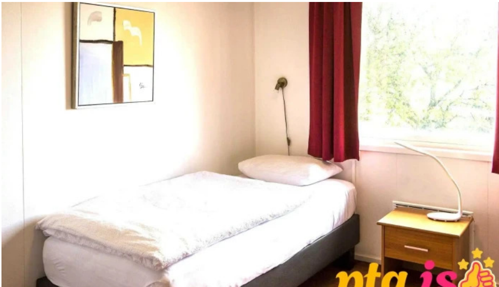
Hofn hi hostel fra eiganda