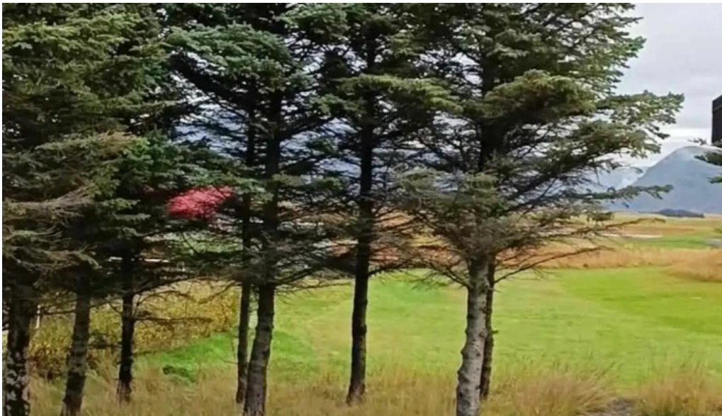
Hofn hi hostel myndskaid