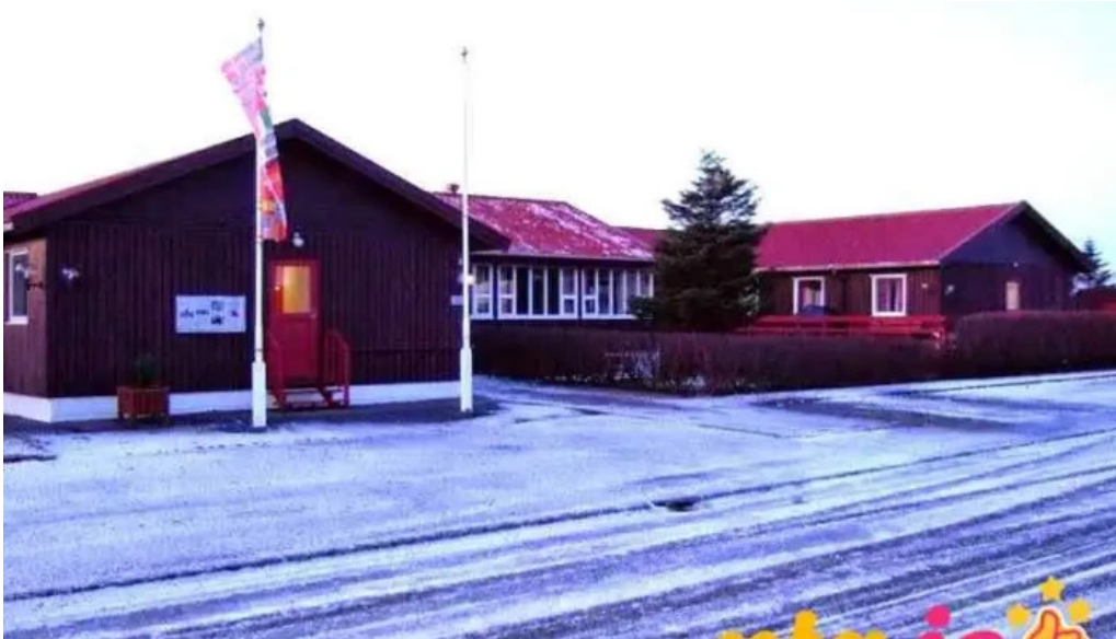
Hofn hi hostel naerumhverfi