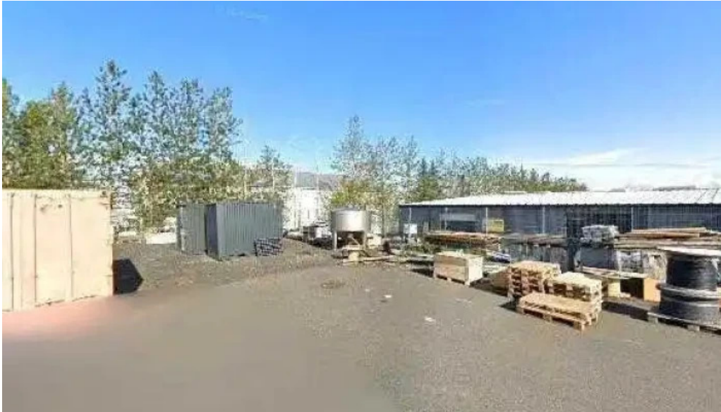
Gardlist street view 360deg