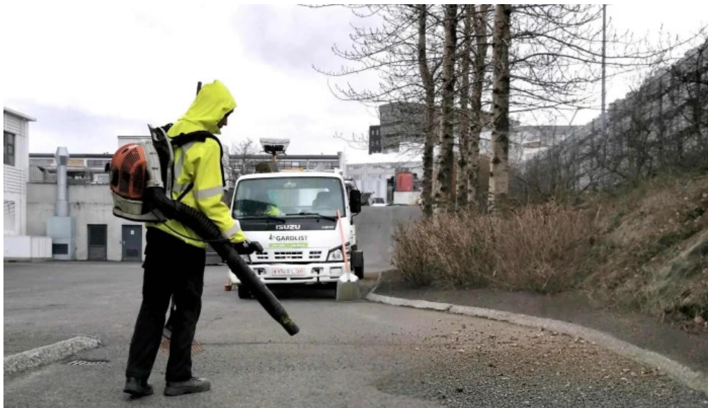
Gardlist fra eiganda