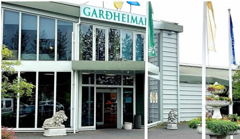
Gardheimar nálægt mer