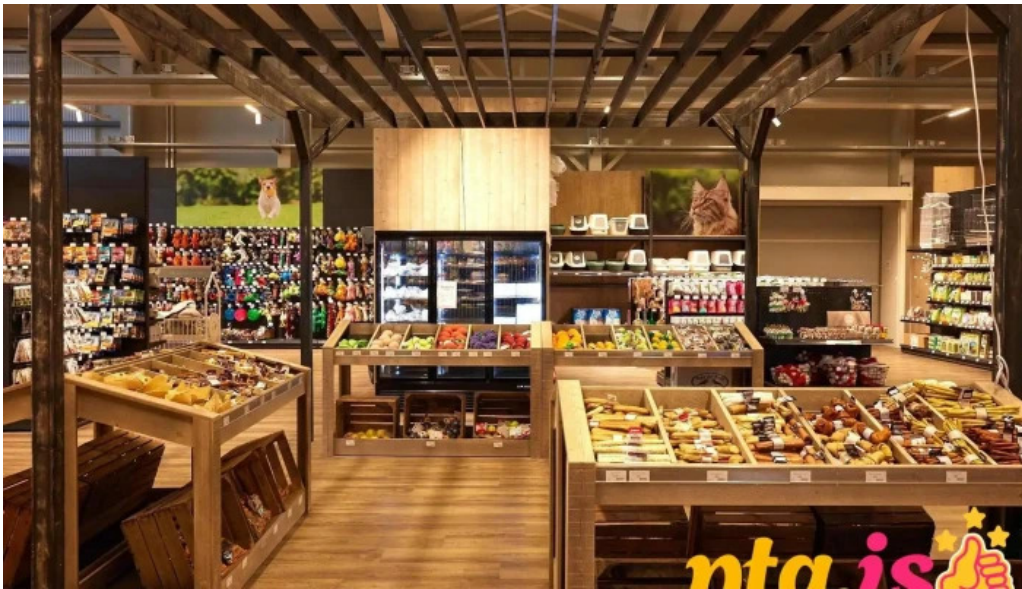
Gardheimar fra eiganda