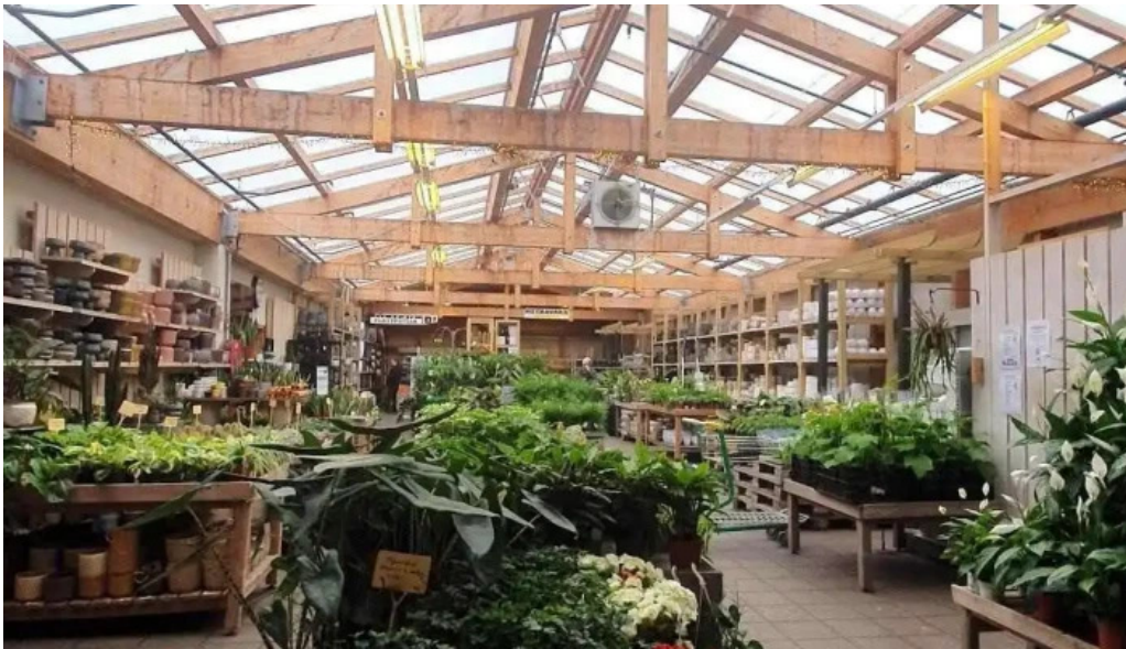
Gardheimar ad innan