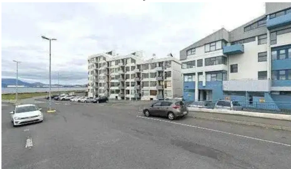
Kennitalan street view 360deg